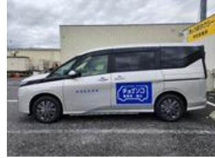
使用車両↑ ※都合により、車両が変わる 場合もあります