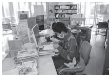
南房総中職場体験