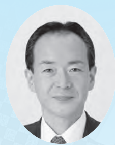
南房総市長 石井 裕