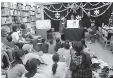
旧図書館での最後のおはなし会 (クリスマス会)

新図書館では規模が大きくなるだけでなく、小さなお子様からお年を召した方まで、多くの人がゆっくり、楽しくお過ごしいただけるよう工夫して設計されていますので、ぜひご来館ください。