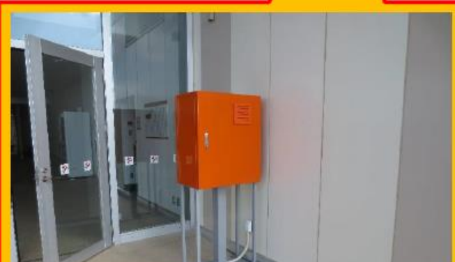
白浜コミュニティセンター