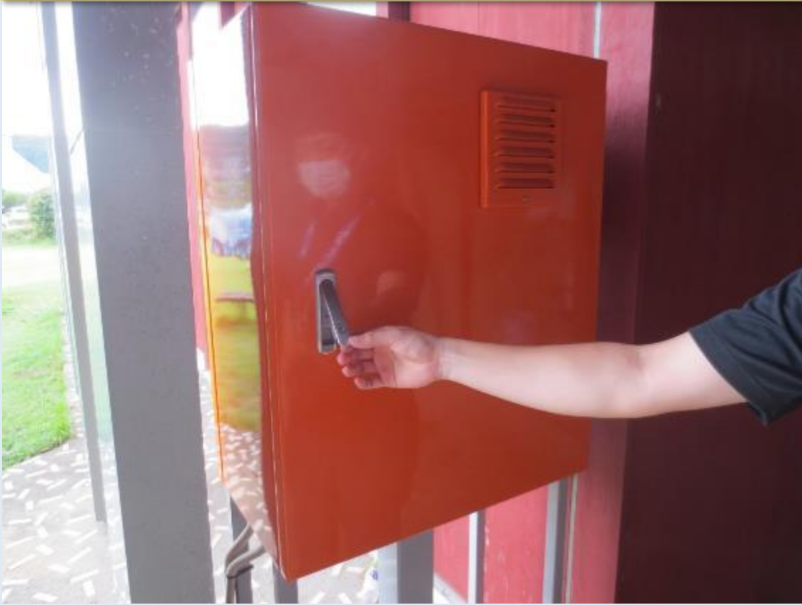
ハンドルを持ち上げ