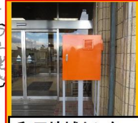
和田地域センター