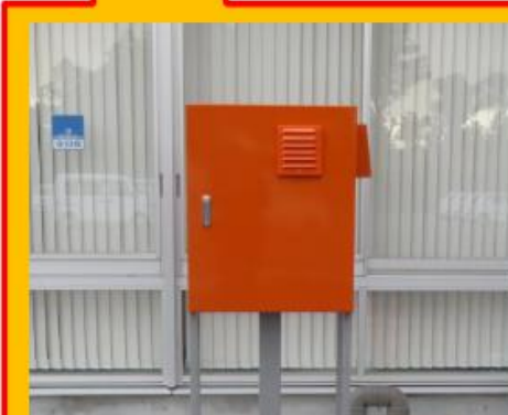
朝夷行政センター