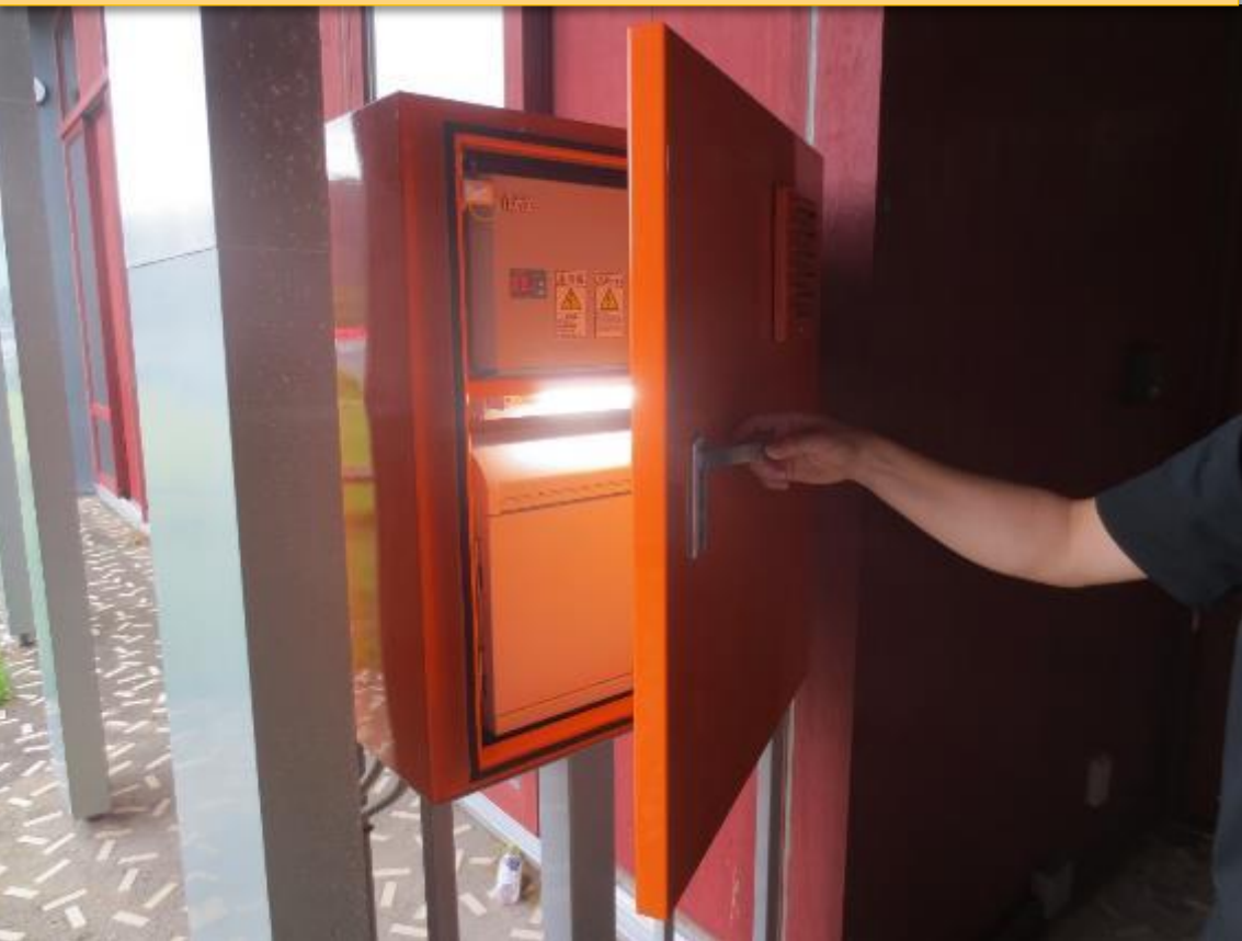
扉を引いて開ける