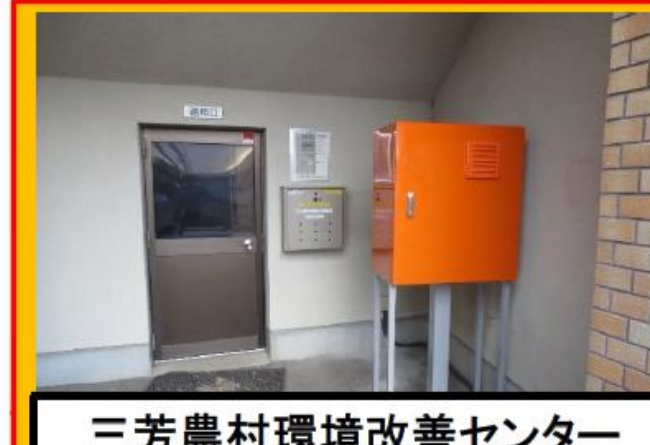
三芳農村環境改善センター