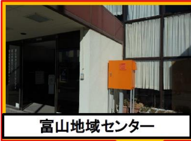
富山地域センター