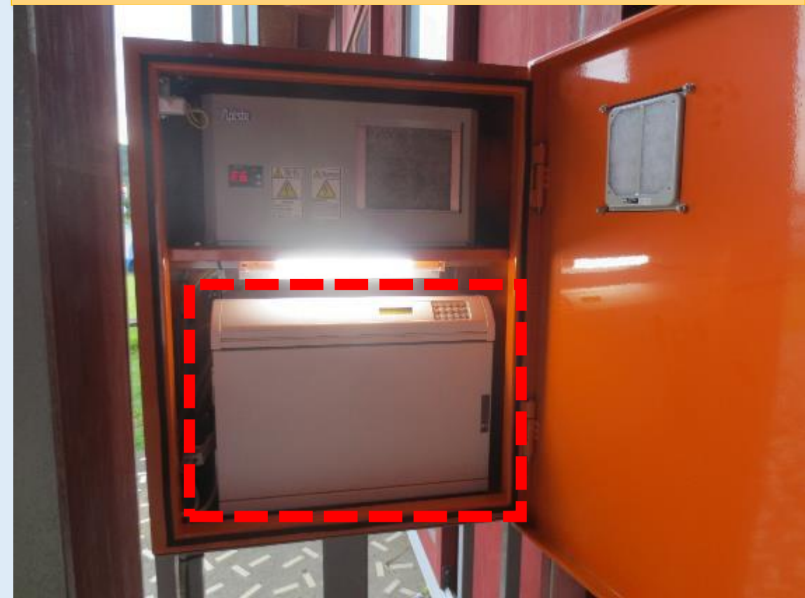
下段がキーボックス