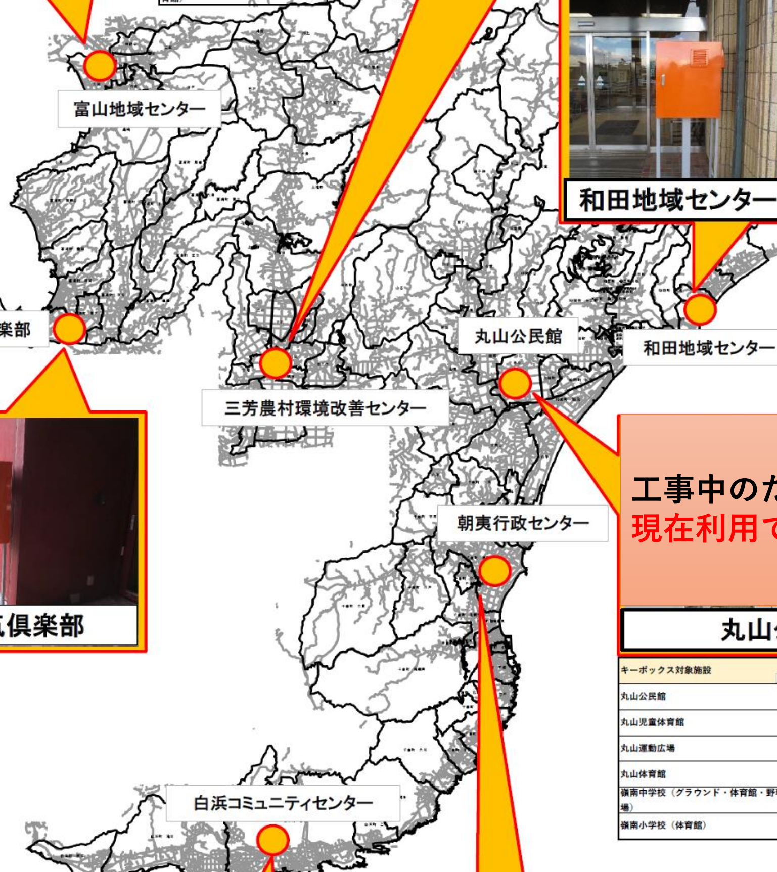
とみうら元気倶楽部