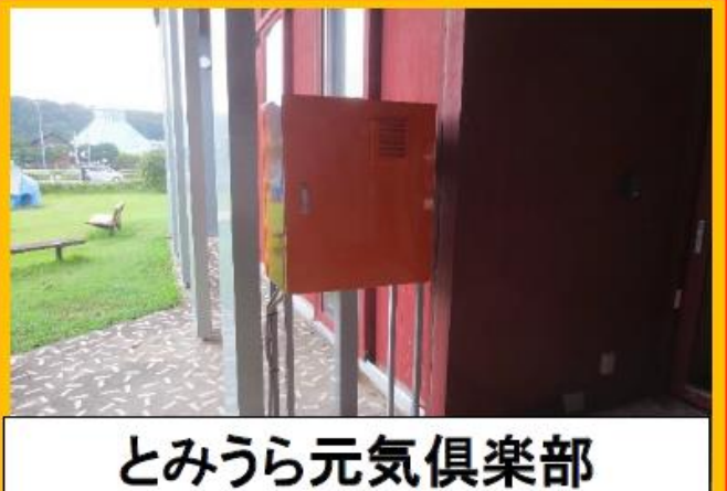
とみうら元気倶楽部