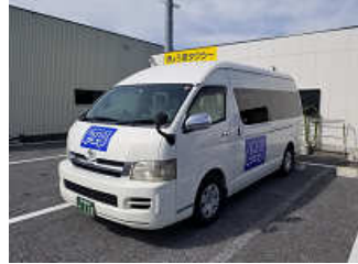
使用車両↑ ※都合により、車両が変わる 場合もあります