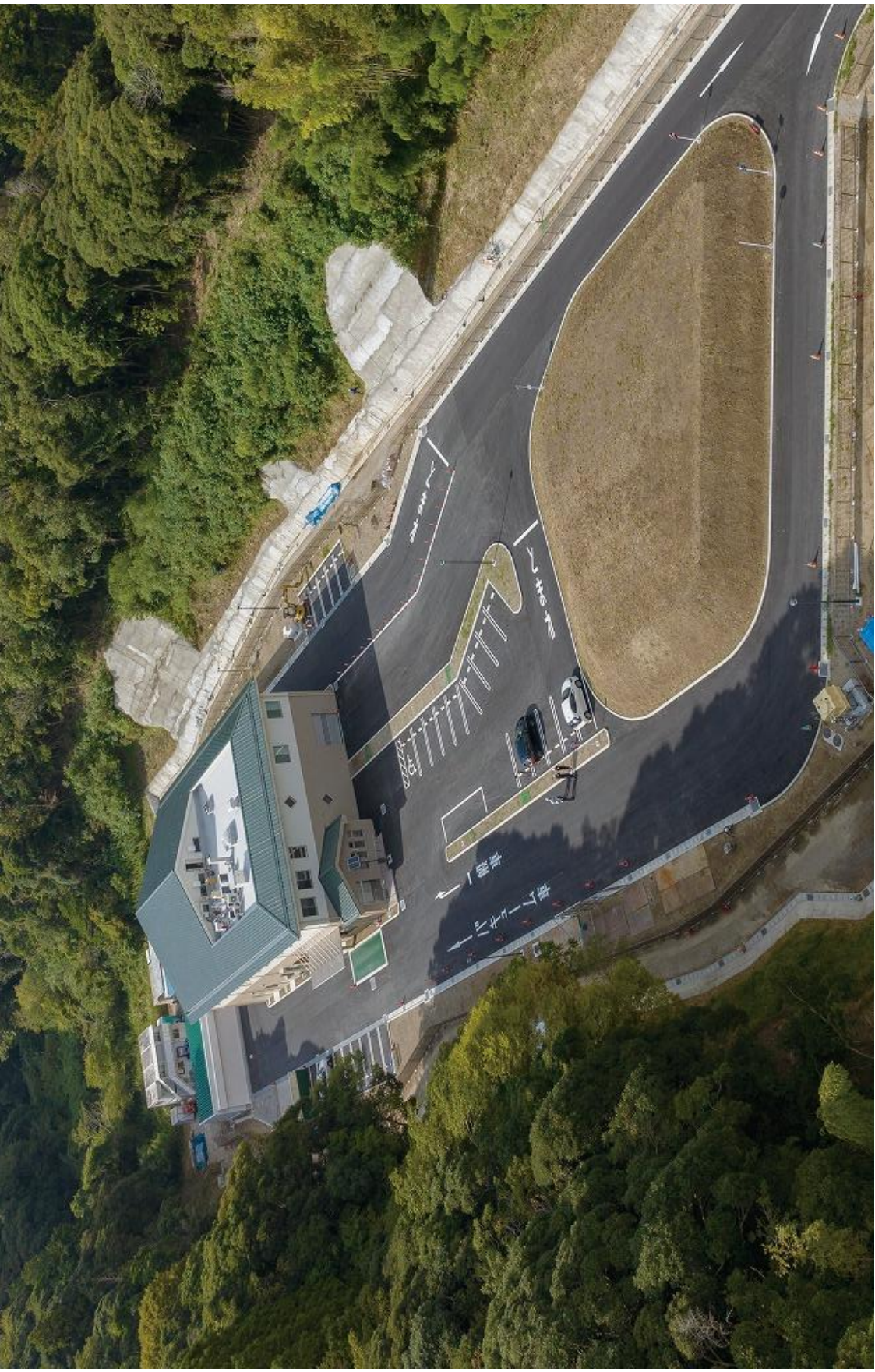
南房総市水処理センター外観