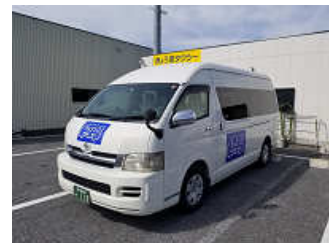
使用車両↑ ※都合により、車両が変わる 場合もあります