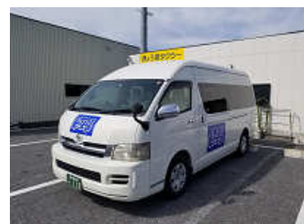
使用車両（ロゴマーク付き）