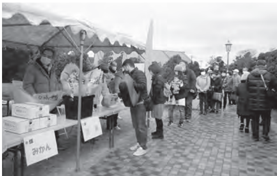
昨年の農業まつりの様子

りまるやま」も構成団体の一つとして参加し、豪華景品が当たるガラポンくじ(午前・午後 各200本)を実施するほか、防災食や豚汁の販売、フラワーフォトコンテストの入賞作品の展示などを行います。 都合により若干内容を変更して行う場合もあります。 多くの人のご来場をお待ちしております。