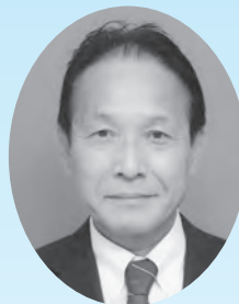
議長 清 川上 市議会

結びに、本年が皆様にとって健康で幸せな年となりますよう祈念して新年の御挨拶といたします。