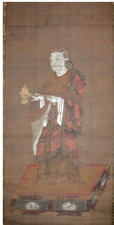
絹本着色聖徳太子像

石堂寺には、この聖徳太子像に附属する資料として、太子講仲間の住所・名前が書かれた正徳元年(1711)の木箱1個と、延享2年(1745)と明治13年(1880)の古文書2通が残されていました。これら附属資料の内容から、江戸時代～明治時代の石堂寺には、現在の三芳・丸山・和田地区の範囲で組織された太子講の拠点があったと考えられています。