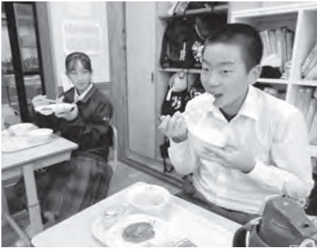
当日の給食の様子