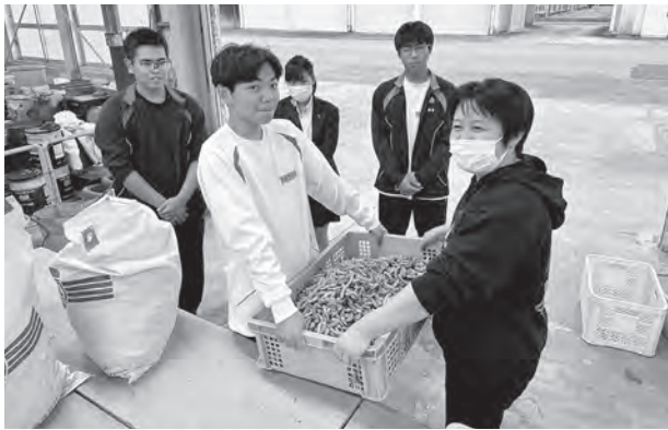
安房拓心高校にて