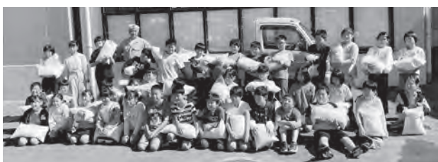
お米寄贈 嶺南小4年