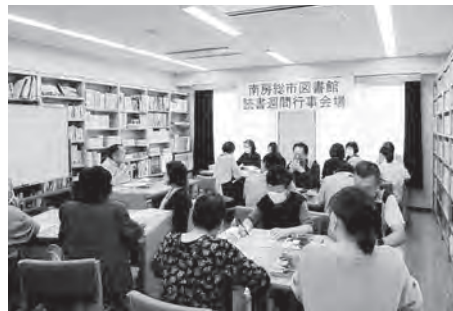
図鑑で星を見よう!