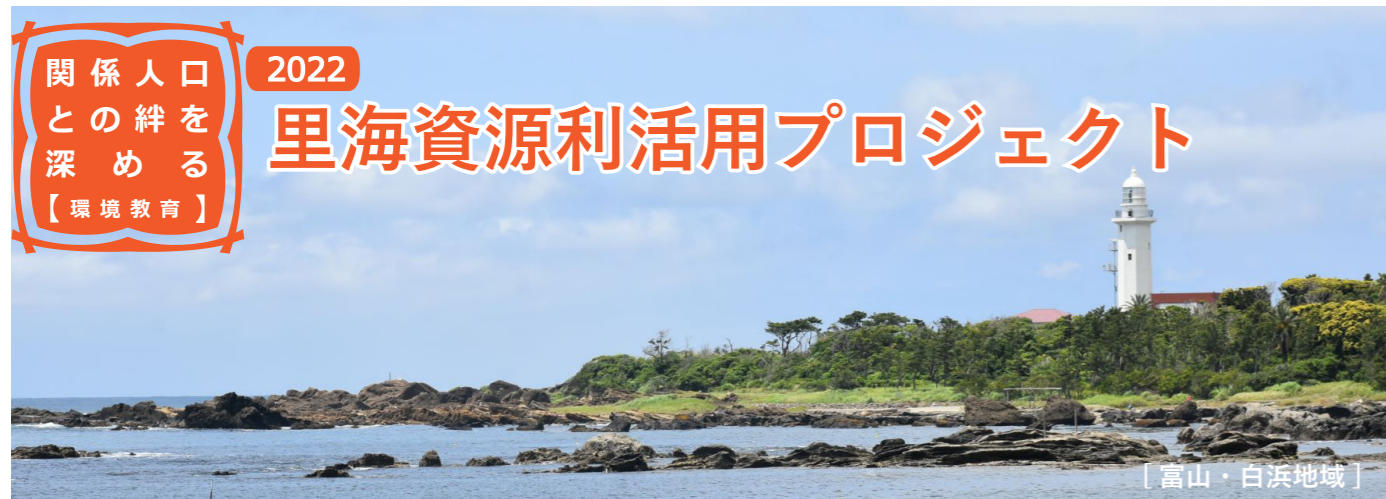
写真-1 磯笛公園から野島崎灯台を望む