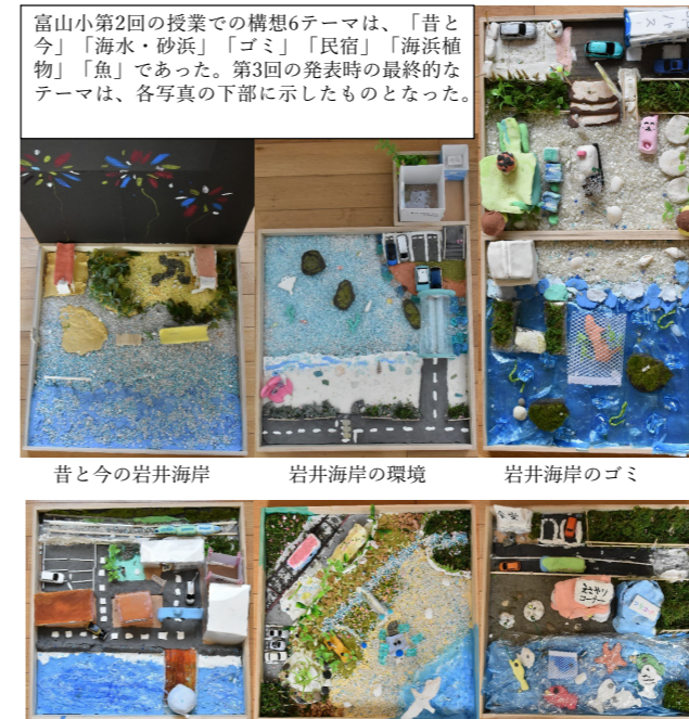
昔と今の岩井海岸 岩井海岸の環境 岩井海岸のゴミ