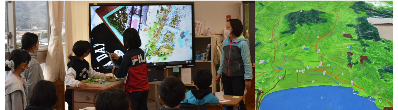
写真-2 富山小学校発表準備状況

富山小学校: 3年目を迎えた富山小学校では、総合学習「ぼく私の考える、これからの岩井海岸～箱庭づくりを通して～」として、計36回の年間予定が担任教諭によって作成された上で実施された。教員の授業回数は、2020年7回、2021年4回に対し、3回(初回・説明、中間・方向性確認、最終・講評)となった。小学校主体の学習メニューとしての計画的な運用が行われ、継続的な実行性が確認されるに至った。