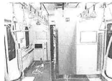
バリアフリースペース・ 車いす対応トイレ

「半自動ドア機能」のご利用方法 ※列車が駅に到着してもドアは自動では開きません。