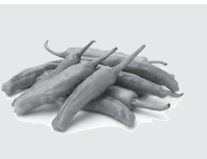
食用ナバナの裏作にオススメです！