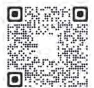
標語応募用 QRコード

提出方法 企画財政課で取りまとめ提出しますので、3月15日(水)までに、メールまたは郵送でお送りください。 提出先