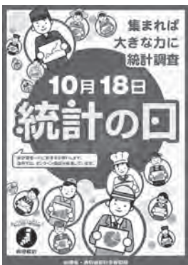
令和4年度「統計の日」ポスター ※令和4年度の特選作品が活用されています。