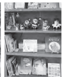
はしごを上るサンタさん 特設コーナー

毎週水曜日(祝日を除く)は、午後7時まで開館しています。皆様のご利用をお待ちしています。