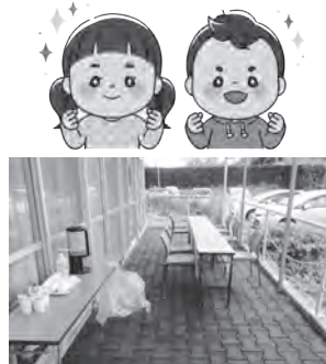
コーヒーコーナー