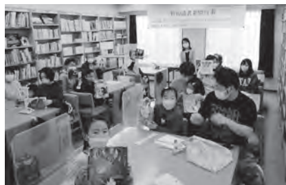
エコバックづくり