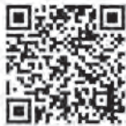
千葉県ホームページ