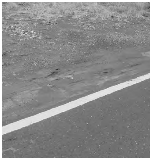
土砂で詰まっている側溝