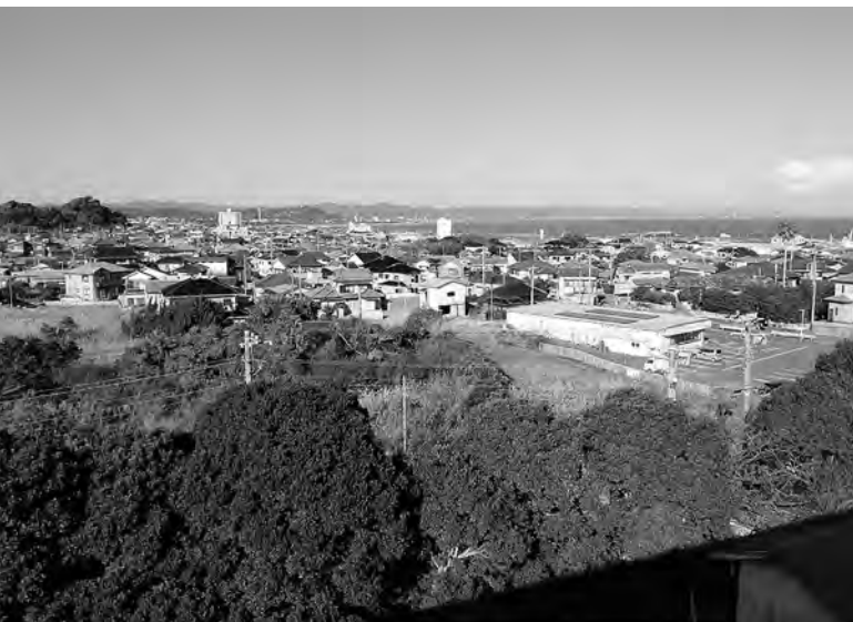
旧忽戸小学校屋上より