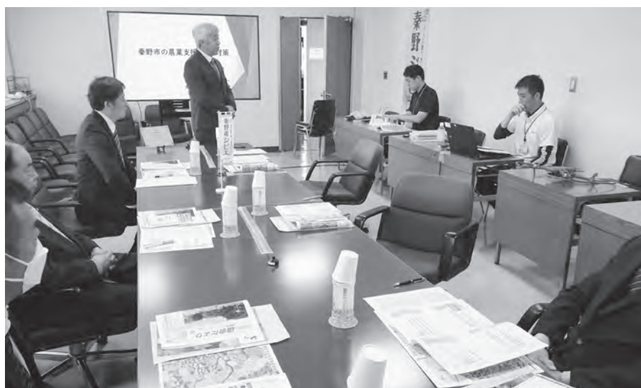
神奈川県秦野市の視察の様子

ような対策ができるのか産業委員会として協議し、今後の有害鳥獣対策に寄与できるように市に提案していきたい。