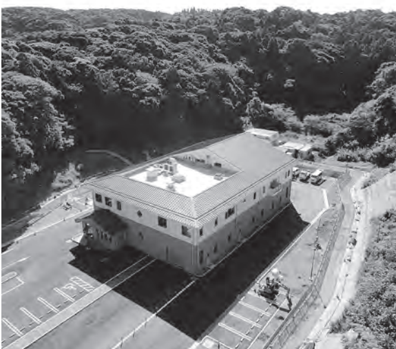
南房総市水処理センター