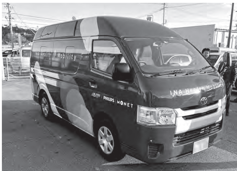
伊那市のモバイルクリニック車両

福祉委員会では、長野県伊那市に委員を派遣し視察調査を行った。これから迎える超高齢化社会。すべての市民に平等に医療を提供し続けることができるのか。