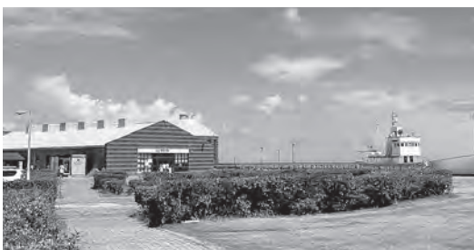
道の駅 ちくら・潮風王国

商工観光部長 なかなか見いだせないが、引き続き関係者の理解が得られるよう協議をしていきたい。