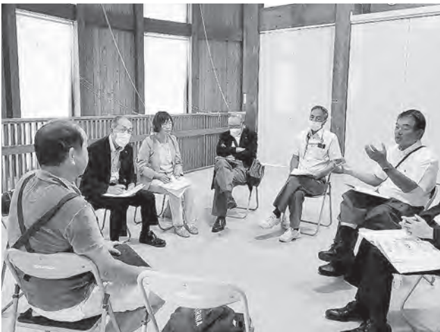
株式会社 近藤牧場