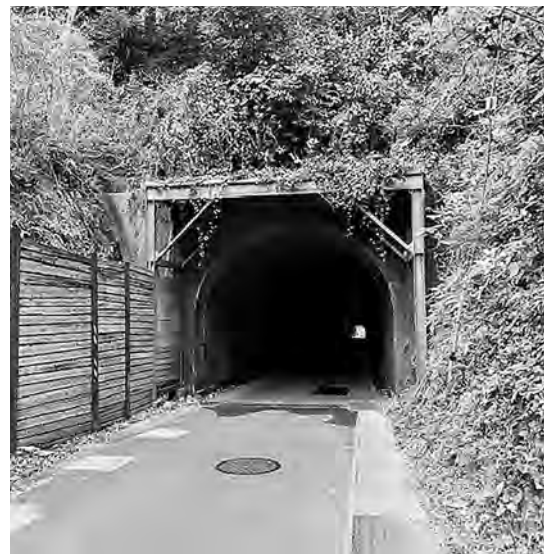
富浦4号線のトンネル

ら寄附があったのか。 健康推進課長 明治安田生命保険相互会社から9月5日に寄附があった。