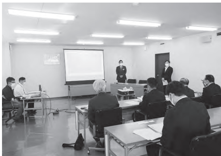
埼玉県飯能市の視察の様子

成し猟友会と一緒に対策しているケース（埼玉県飯能市）とドローンを活用して被害地図を作成し作業効率を上げていくケース（神奈川県秦野市）について視察を行った。