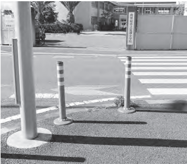
富浦小学校前のセーフティポール

し尿や浄化槽汚泥を搬入する車両台数は1日約50台。バキューム車の運転者に対しては、通学路や通学時間に関わらず、安全運転を徹底するよう指導・監督を行っていく。