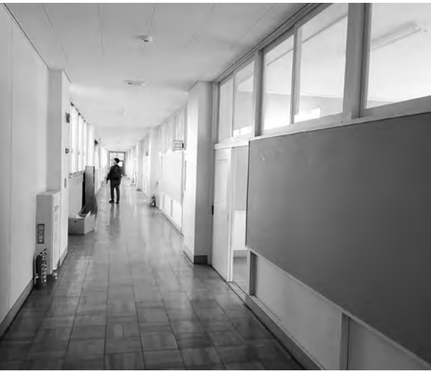
旧忽戸小学校校舎内