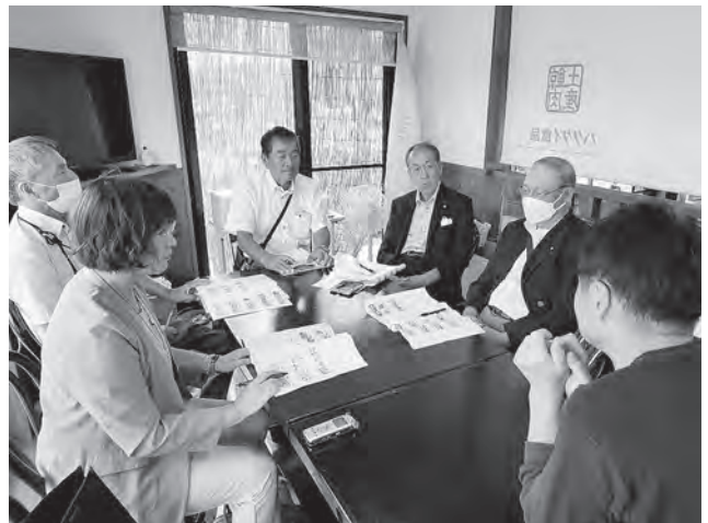
ハクダイ食品有限会社