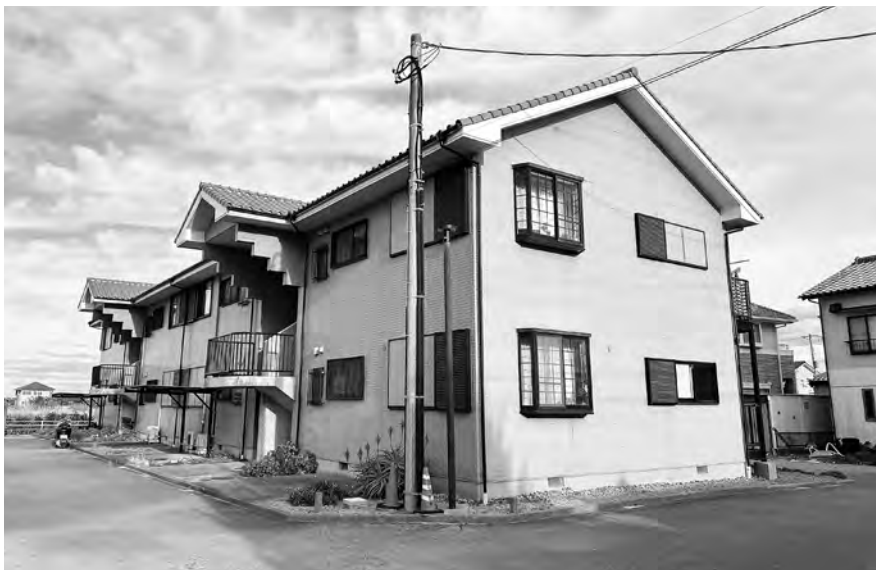
高い防災意識が求められる千田黒潮団地

所の周知を図るほか、防災訓練への参加等、積極的に地域活動へ参加していただき、防災意識を高めるよう促している。