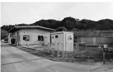
三芳家畜ふん尿処理施設

12月12日、産業委員会が開かれ、付託された議案を審査した。主な質疑・答弁は次のとおり。