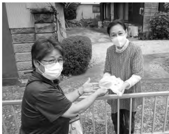
あんしん見守り事業 (みまも〜)