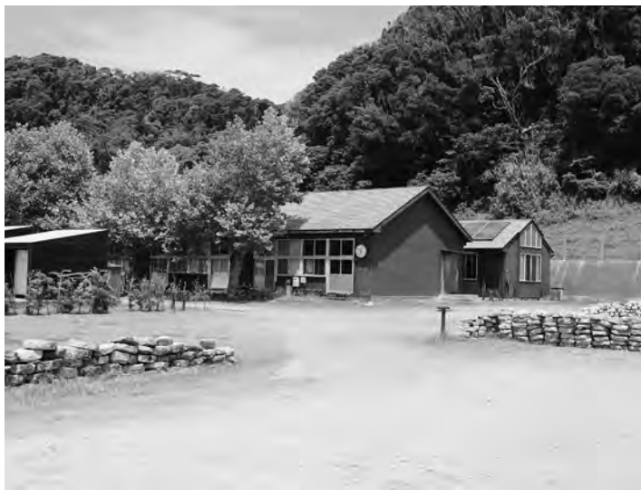
台風被害を受けた旧長尾小