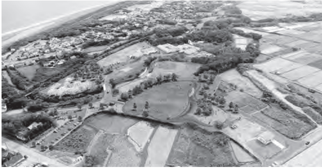
公園のイメージ図

6月12日、総務委員会が開かれ、付託された議案を審議した。主な質疑・答弁は次のとおり。