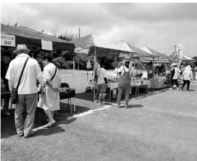
オーガニックマルシェ