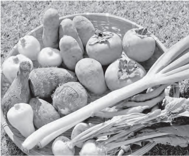
無農薬野菜（イメージ）