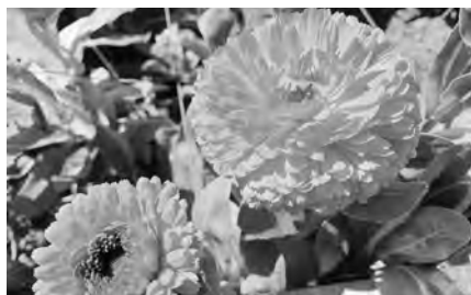
カレンデュラ (キンセンカ)

総務部長 市長出前講座は申込み制のため、これまで市内の高校生に対して市長出前講座を行ったことはない。