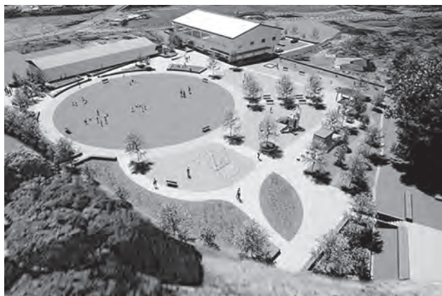
旧平群小学校等跡地整備イメージ図

頂いた意見を参考に、地元の方々をはじめ、多くの方の憩いの場になるよう整備していきたい。