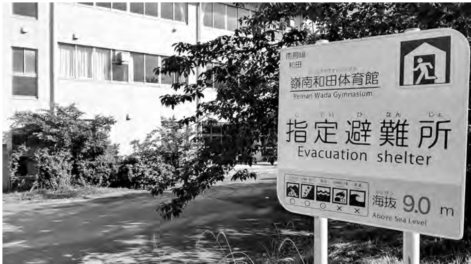
旧嶺南中学校和田校舎

市民生活部長 避難訓練に限らず、地元との連携は大事である旨、社会福祉法人太陽会と考えを共有している。