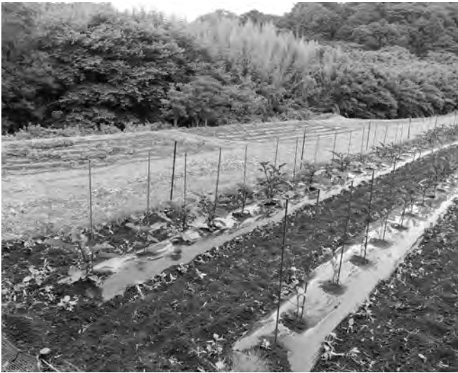
千倉町久保の有機栽培中の野菜

ク米は使っていない。野菜は地元の農家から納入している。その中でオーガニック（有機）農業に取り組んでいる方々からも納入している。学校給食は有機農業に理解がないということではなく、地元の方々に必要な量の食材を生産確保できるものを納入を進めている。