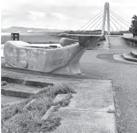
和田・白渚海岸防潮堤道路