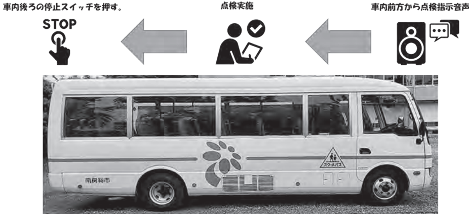
置き去り防止安全装置の仕組み

と車内前方に設置してあるスピーカーから「車内点検を行ってください」「子どもが残っていないか確認してください」という自動音声の流れ、運転手は車内後方まで移動し、車内を点検するとともに車内後方に設置してある点検ボタンを押すことで自動音声が終わる。エンジンを切った後、点検ボタンを押さないまま10分間経過すると、車外スピーカーから警告アナウンスが流れるシステム。