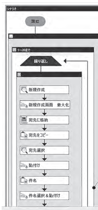
人の手で行う作業をRPAで簡素化

問 コロナ禍は介護認定の2次審査会を書類審査で行っていたものを、現在は対面に戻しているが、今後はどうしていくのか。