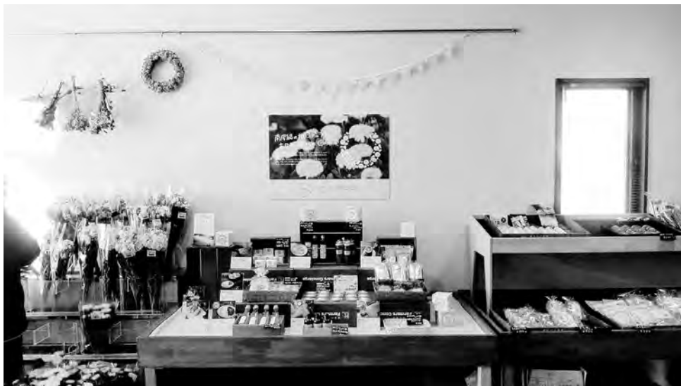
道の駅白浜野島崎 カレンデュラブース (令和2年2月撮影)