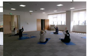
体操でリフレッシュ