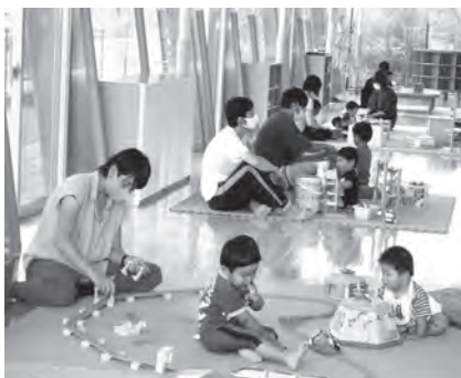
にこにこひろばの様子