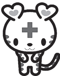
日本赤十字社公式 マスコット・キャラクター 「ハートラちゃん」