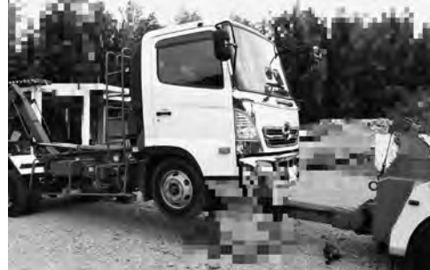
差押え自動車の引揚げ例

千葉県は、自動車税(種別割)の未納額の縮減のため、10月から5月までを滞納整理強化期間とし、給与・預金・自動車などの差押えを一層強化します。