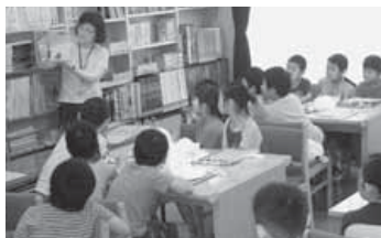
<絵本「あおいかさ」の話を聞く>