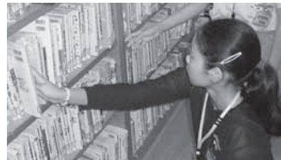
<書架に本を戻す体験>