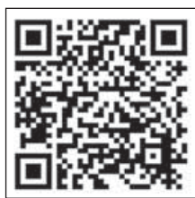
申込ホームページ用 QRコード