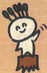
イメージキャラクター マモルくん