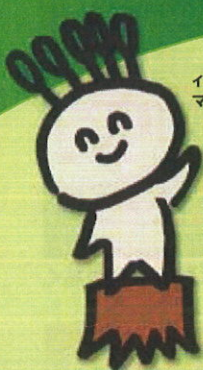
イメージキャラクター マモルくん