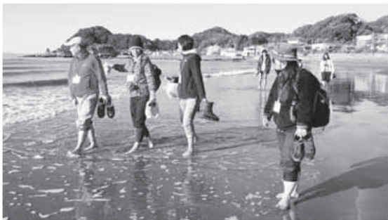
波打ち際を素足で歩く海岸線タラソテラピーウォーク

市と共にヘルスツーリズムによるまちづくりを推進している、(一社)南房総健康ラボが提供する「癒しの森のセラピーウォーキング」プログラムに対し、ヘルスツーリズム認証が交付されることが決定しました。