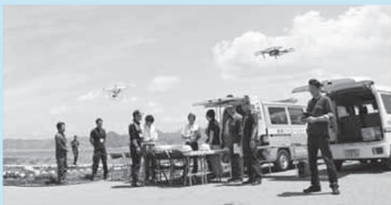
市ではドローンの更なる有効活用を検討するため「ドローン研究会」を立ち上げました

富浦漁港周辺を会場に、市職員、安房消防、館山警察署、海上保安庁、災害協定を締結している大和印刷有限会社の社員、合計23人が参加し、ドローンを活用した海上捜索訓練を実施しました。