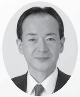
南房総市長 石井 裕

明けましておめでとうございます。輝かしい新春を迎え、謹んで新年のお慶びを申し上げます。