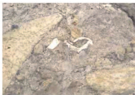
シロウリガイ化石