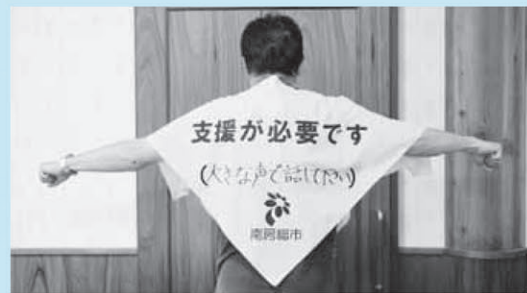
支援が必要な理由を記載しておきます

災害が発生し、避難行動要支援者が避難所に避難するときや、避難生活をしているときなどに、支援が必要であることを自らアピールする布製防災用具「ポンダナ」を作製しました。ポンチョとしてもバンダナとしても使うことができることから、「ポンダナ」と名付けました。