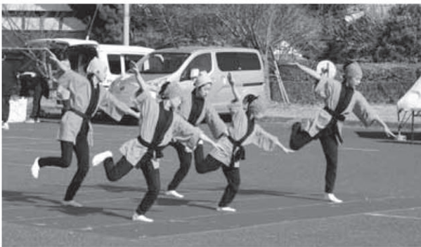
会場ではさまざまな催しが行われます