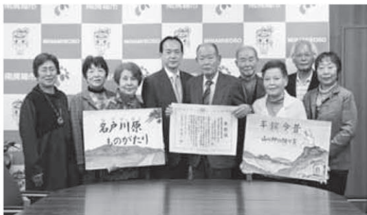
老人クラブメンバーが発起し、行政区組織を中心に「区民の茶の間」を設置しました

千倉町平館区「区民の茶の間」が、厚生労働省が主催する「第7回健康寿命をのばそう!アワード」において団体部門優良賞を受賞しました。高齢者だからこそできること、果たすべき役割を模索した活動などが評価されました。