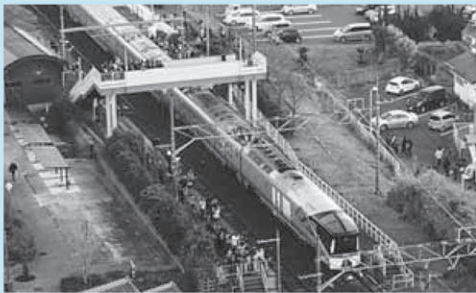
30分ほど停車し初日の出を鑑賞しました

豪華寝台列車「トランスイート四季島」が、初日の出を鑑賞するお客さんを乗せて和田浦駅にやってきました。