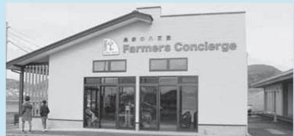
冬から春にかけて隣接するビニールハウスでイチゴ狩りも楽しめます

花の情報館(道の駅白浜野島崎)敷地内に、農産物直売所「Farmers Concierge (ファーマーズコンシェルジュ)」がオープンしました。