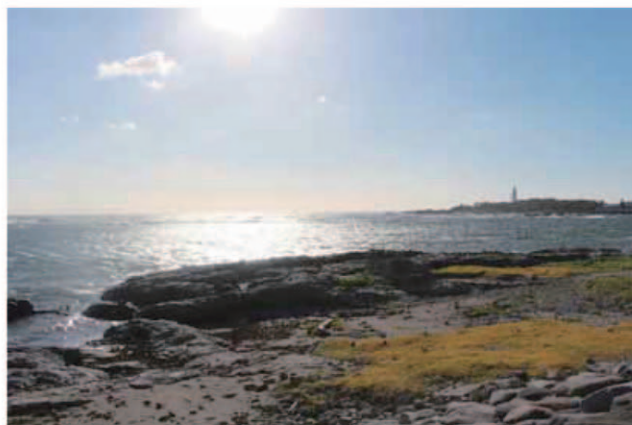
シロウリガイ化石露頭全景