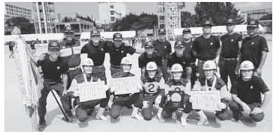
優秀賞に輝いた第4支団第2分団

第54回千葉県消防操法大会に、安房支部代表として出場した第4支団第2分団(白浜町原・小戸・下沢)が、ポンプ車操法の部で2位となる優秀賞に輝きました。