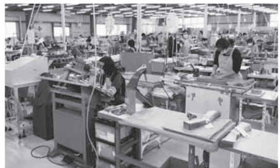
グロリア(株)は主に官公庁・民間特需ユニフォームの製造・販売事業を営む会社です

遊休施設となっていた旧丸小学校・幼稚園の活用事業者である、グロリア(株)の新社屋が完成しました。グロリア(株)は、平成28年3月に閉校・閉園となっていた旧丸小学校・幼稚園の利活用の公募により、活用事業者に決定しました。