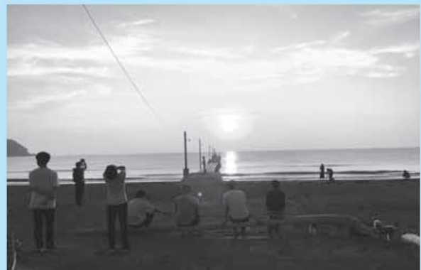
夕陽を見にたくさんの人が訪れます