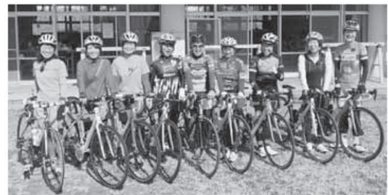
人気メーカーのクロスバイクをレンタルしています

週末に開放されるクラブハウスの運営のほか、WEBなどでの情報発信、外国人対象のツアーの企画運営を行っている、南房総(あわの国)サイクルツーリズム協会は、新たにクロスバイクのレンタルサイクルを開始しました。