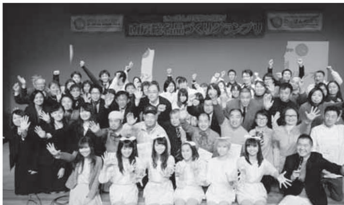
第2回「南房総名品づくりグランプリ」出場者と審査員のみなさん

時間／12:30～15:40 グランプリ大会(さざなみホール) 10:00～16:00 出店販売(会場前広場)