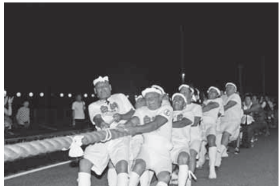
長さ150m、重さ1tの大綱で綱引きをする「大綱武士絵巻」。200人对200人の大熱戦。