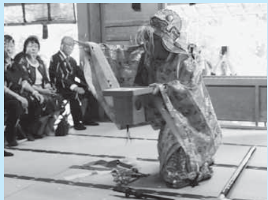
四方に紙吹雪をまく「麻の舞」

江戸中期頃から奉納されたと言われているこの舞は、11月23日の新嘗祭でも奉納されます。