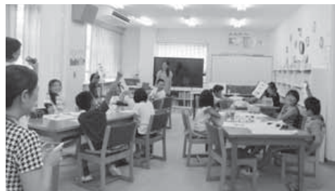
南三原小学校4年生