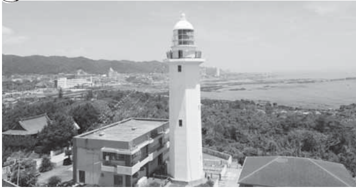
野島崎灯台は日本最初の洋式灯台8灯台の一つです。 「日本の灯台50選」にも選ばれています。