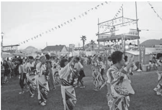
やぐらを囲んで踊られた白浜音頭の総踊り。新しいご当地ソングも踊られました。