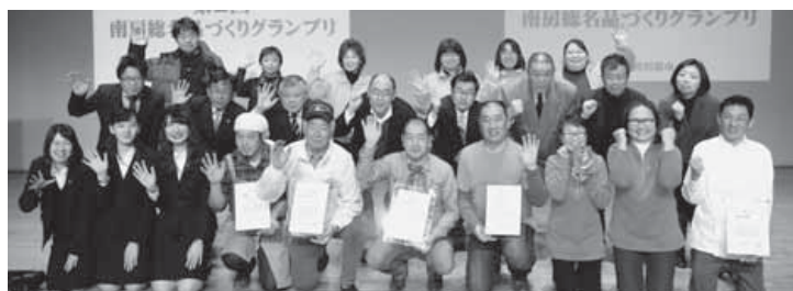
第2回「南房総名品づくりグランプリ」出場者と審査員のみなさん