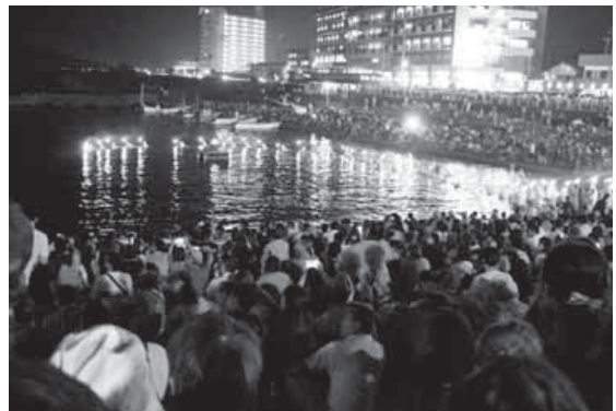
幻想的な世界に包まれた海女の大夜泳。たくさんの人がその雰囲気酔いました。