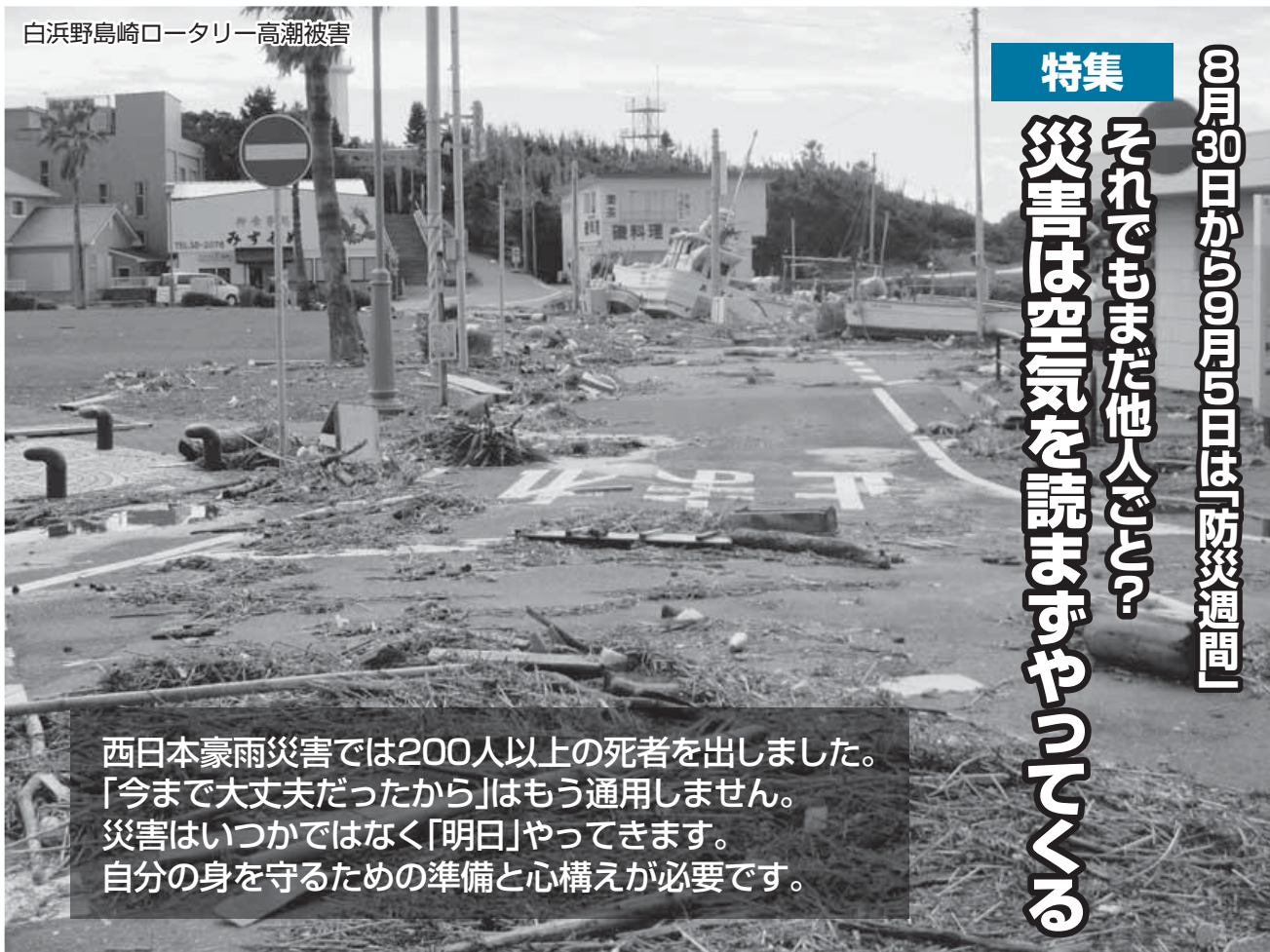
白浜野島崎ロータリー高潮被害

西日本豪雨災害では200人以上の死者を出しました。「今まで大丈夫だったから」はもう通用しません。災害はいつかではなく「明日」やってきます。自分の身を守るための準備と心構えが必要です。