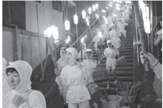
伝統衣装「磯着」を身にまとい、右手にたいまつを持った海女が海に向かいます。

14、15日の「海女の大夜泳」、16日の「大綱武士絵巻」を中心に、白浜大盆踊り、巖島神社の御神輿連行・渡御、郷土芸能、アイドルのバラエティーショーなど、さまざまなイベントが会場を盛り上げました。