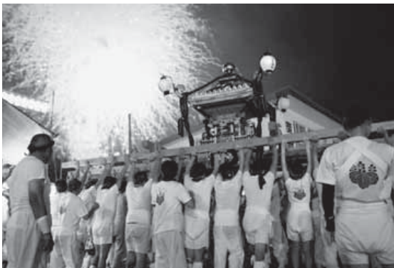
古くから島崎地区で受け継がれてきた巖島神社の御神輿。