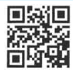
登録用 QR コード