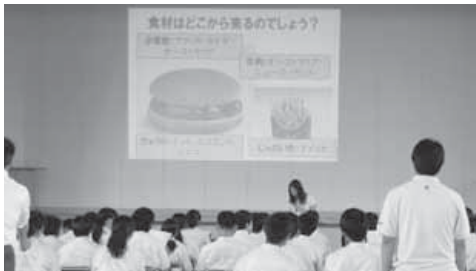
富浦中学校全校生徒