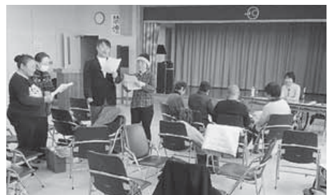
25 人が参加しグループに分かれて練習しました。

その後、グループごとに発表、中身の濃い研修となりました。参加者から「大変勉強になった」という声が聞かれました。日々の読み聞かせに活かすことを期待します。