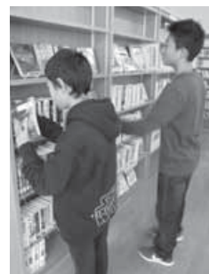
本を整理するようす

また、3人は図書館カードを持っていなかったため、交付申込書に記入し、パソコンを使い、自分でカード登録をする体験もしました。図書館の仕事を通して、将来への目標をもつことができたのではないかと思います。目標達成に向け、たくさん読書をしていただけることを期待しています。