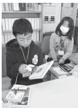
貸出と返却処理のようす

12月初めに、図書館の仕事に興味を持っている3人が仕事体験をしました。図書館員になって本の貸出と返却処理、予約本を探したり、本の整理(あいうえお順に並び替える)をしたりする作業などを行いました。