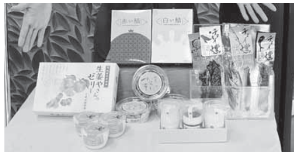
第1回大会に出品された商品が道の駅などで人気になっています。