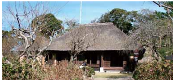
国指定重要文化財 旧尾形家住宅(丸山・石堂)

A 「長い歴史の中で生まれ、今日まで守り伝えられてきた財産」です。市の歴史や伝統を表しており、未来に伝えていく必要があります。