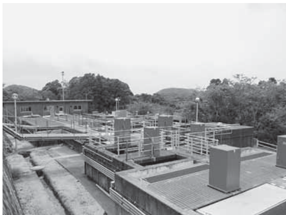
白浜浄水場(白浜地区白浜)