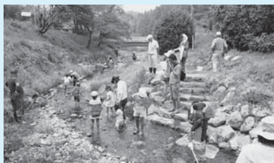
NPO 法人南房総エコネットの生きもの観察会