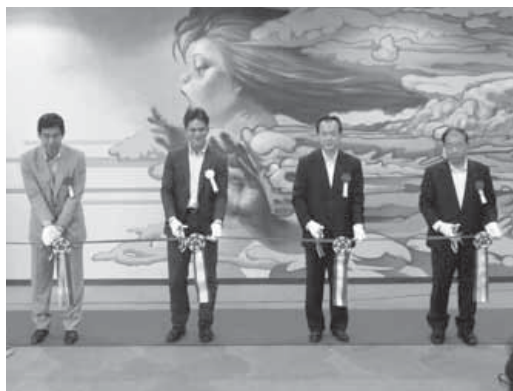
壁画の前でテープカットする様子

館内には各所に壁画が施され、大ホールや会議室にはダンス利用のための大型鏡が設置されました。旧保健福祉センターは宿泊を可能にする