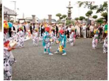
国指定重要無形民俗文化財 白間津のオオマチ(大祭)行事 (千倉・白間津)