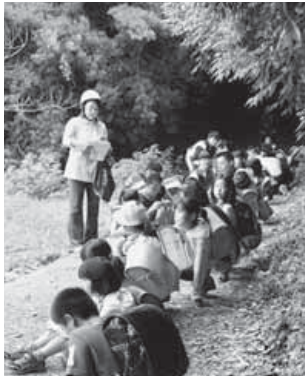
小中学校一斉避難訓練