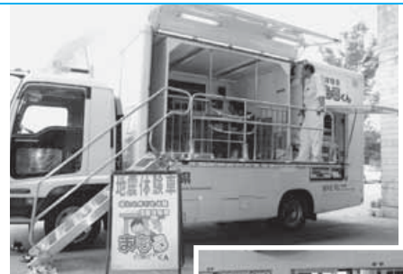
施設で実施する地域地震発生時の避難場所(丸山)協議会 中た乗り 嶺さ搭 領さ搭 く