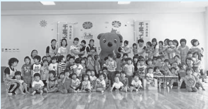
チーバくんと一緒に記念撮影(保育所園児)