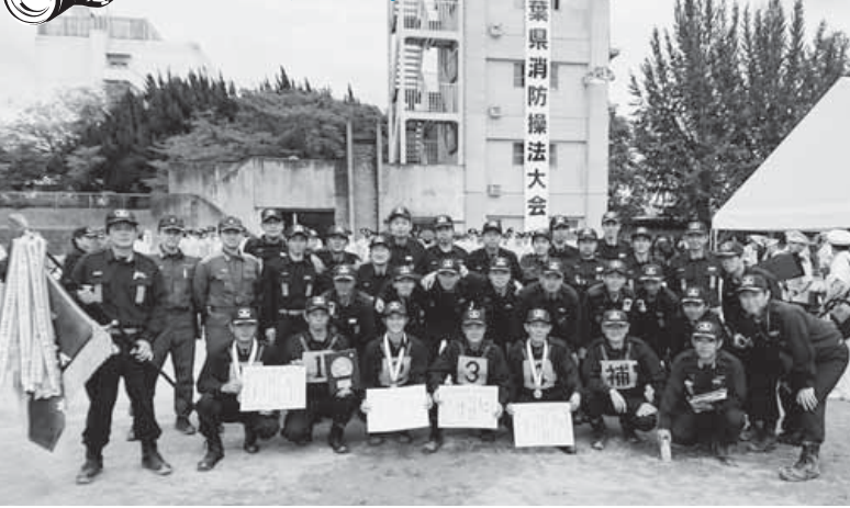
最優秀賞となった第5支団第3分団のメンバー