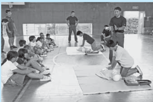
実際に人形を使用して手順を覚えました。

対象者の発見から周辺の安全確認、救急車手配やAEDを持ってきてもらう協力依頼、心肺蘇生という一連の流れを身に付けました。