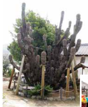
県指定天然記念物 岩井ノ蘇鉄 (富山・竹内)

A 指定文化財(国・県・市が指定した文化財)だけでも市内に218件あります。また、これとは別に埋蔵文化財包蔵地(いわゆる遺跡)が441ヶ所あります。