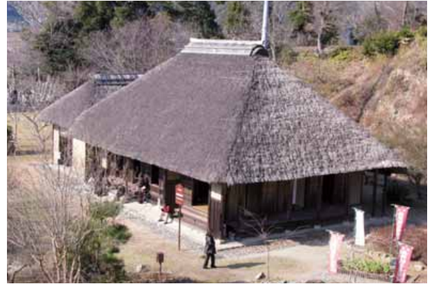
旧尾形家住宅遠景