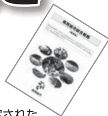
策定された「南房総市総合戦略」

全国的に「まち・ひと・しごと創生」の取り組みが行われています。この取り組みは、地方において「しごと」と「ひと」の好循環の確立と、それを支える「まち」の活性化に一体的に取り組むことにより、人口減少に歯止めをかけるとともに、それぞれの地域で住み良い環境を確保し、将来にわたって活力ある日本社会の維持をめざすものです。