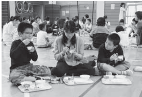
和田小学校の家庭教育学級の給食試食会で、保護者もヨーグルトを味わいました。

このヨーグルトは、安房拓心高校の畜産系列の生徒が飼育している乳牛ホルスタインから絞った牛乳でつくられており、香料や着色料、保存料など一切使用していません。搾乳から製造まで、すべての工程を生徒たちが手掛けているため製造個数に限りがあり、市販せず一部のイベントのみで販売されているものです。