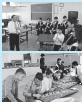
尺八の体験(上)と、箏を体験するウィスコンシン州の生徒