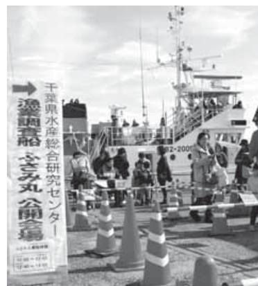
昨年の漁業調査船ふさみ丸見学