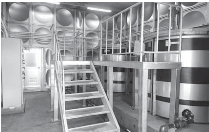
白浜浄水場活性炭室内部

この設備によって、市営水道の水質の向上(基準値強化の対象物質や総トリハロメタン ※2 の低減、臭気の除去)に効果を上げており、安全で安心な水道水をお届けしています。