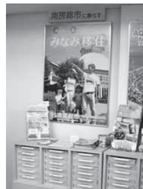
東京都の「ふるさと回帰支援センター」に設置している南房総市PRコーナー