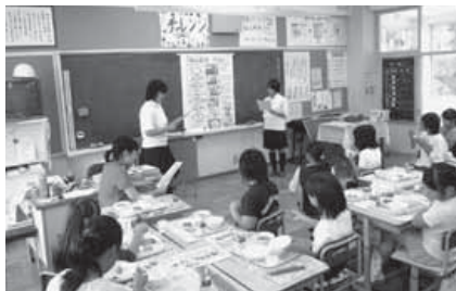
南三原小学校で安房拓心高校の生徒がヨーグルトのつくり方を説明してくれました。