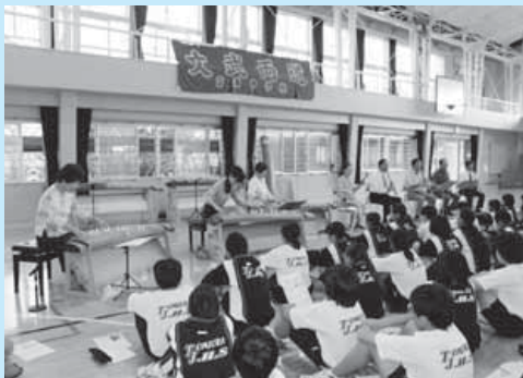
千葉県三曲協会の会員による箏、三味線、尺八による「六段の調」の演奏