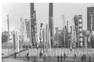
各代表ののぼり旗