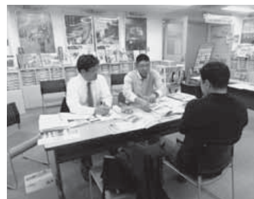
東京都で行った移住相談会

移住する人と、市内の空き家をマッチングするため、南房総市空き家バンク協議会が「空き家バンク」を運営しています。