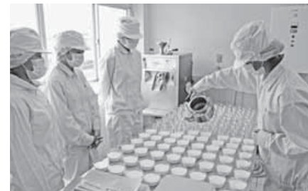
安房拓心高校でヨーグルトを製造しているようす。生徒が交替で丁寧に容器に入れます。