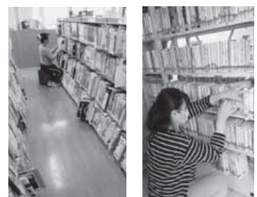
【図書館：図書館職員による点検】

10月1日より通常の貸出返却業務を進めているところですが、新システムを導入したパソコンの取り扱いに戸惑うこともあります。しかし、今後も皆さんの期待に応えていけるよう努力していきたいと思っております。