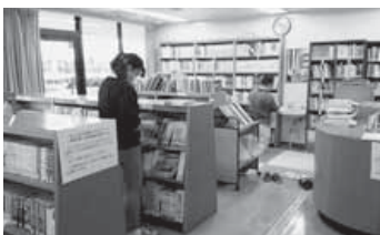
【公民館：地域センター職員と図書館職員と一緒に点検】

9月20日より30日まで蔵書点検のため各地区の公民館などの図書室と本館を閉館した際はご不便をおかけ