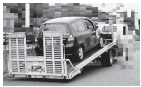
※差押え自動車の引揚げ例

問 千葉県館山県税事務所 ☎22-7117 千葉県総務部税務課 ☎043-223-2127