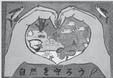
平成28年度 最優秀賞作品