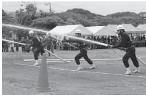
昨年の安房支部消防操法大会のようす