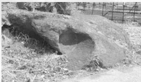
黒星と呼ばれる岩