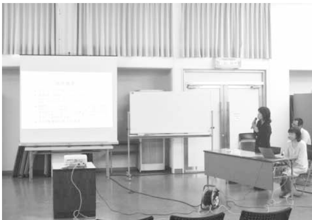
公開プレゼンテーションの様子

家庭の生ごみを堆肥化する講習会や支援活動、生ごみ堆肥を使った休耕田の活性化や、側溝・河川・海の浄化活動を行います。