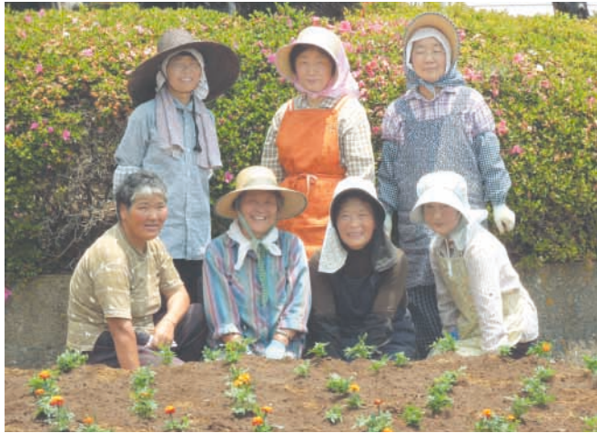
丸山地域センター花壇に集合した「てんとう虫」の皆さん