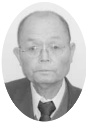
川崎 堯 公選