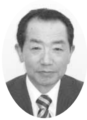
穂積 一男 公選