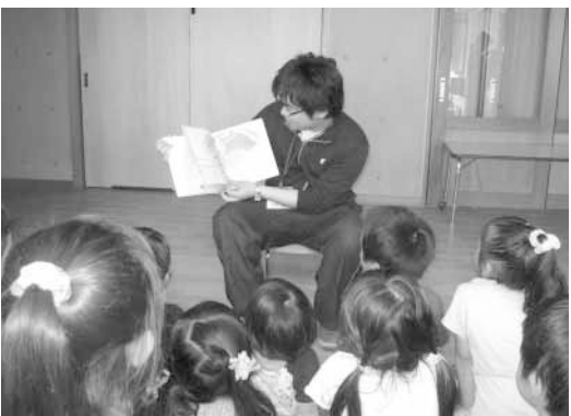
幼稚園で絵本の読み聞かせを体験する研修員