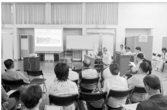
公開プレゼンテーションには、たくさんの方が参加しました

市内道の駅とタイアップし、8月5日(日)に夕涼み竹燈ライトアップを行います。水仙まつり(1月中旬)では、竹燈づくり体験とライトアップを行います。竹の有効活用を研究します。