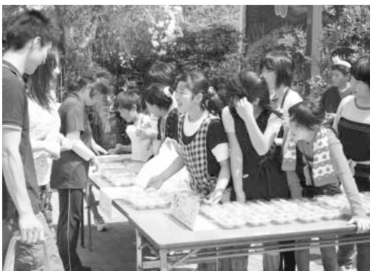
元気にびわを販売する富浦小学校6年生