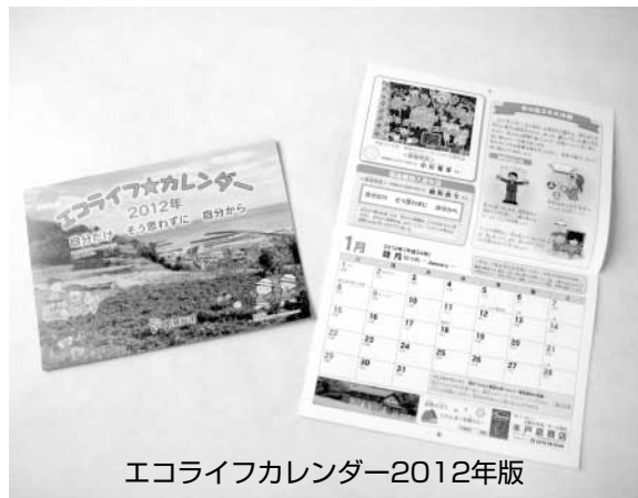
エコライフカレンダー2012年版

〒299-2492 南房総市富浦町青木28番地 南房総市環境保全課 ☎ 33-1053 FAX 20-4597 電子メール kankyo@city.minamiboso.chiba.jp