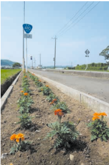
国道410号沿いの花壇