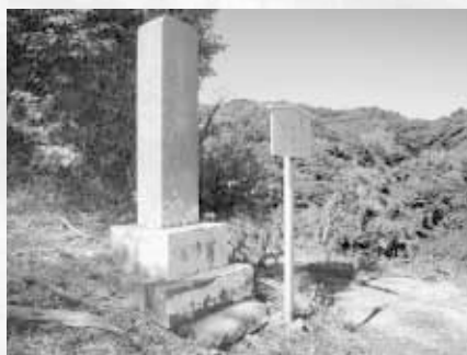
市の指定史跡「請雨塔」 (昭和50年11月1日指定)

集まっていた村人はびっくりしてしまいました。上人の法力はたちまち有名になり、後の世まで語り継がれて、堀切の堰に請雨塔が建てられたのです。