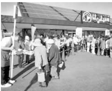
開店を待つ長蛇の列

産物直売所をはじめ、地元食材を使った加工品、みやげ品の販売や食事・デザートにも力を入れ、食のテーマパークを目指します。