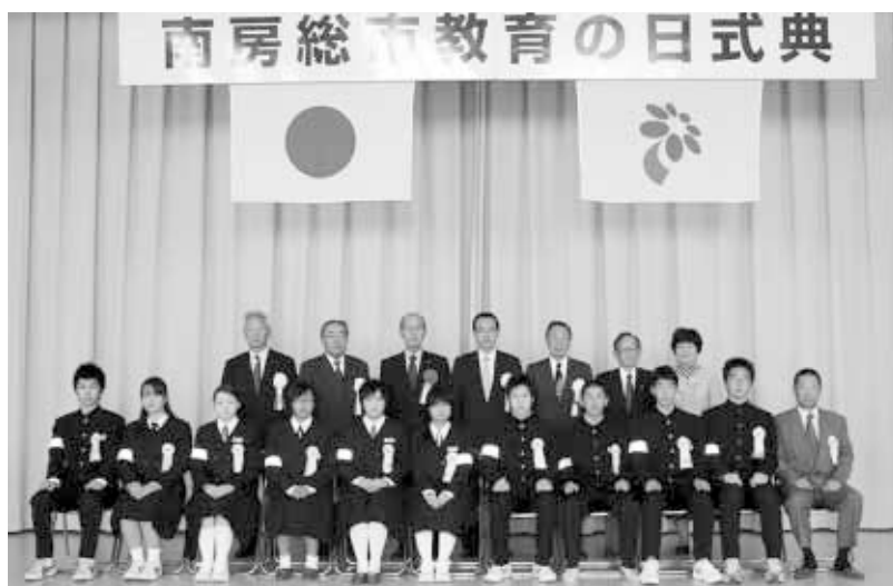
表彰された皆さんと関係者