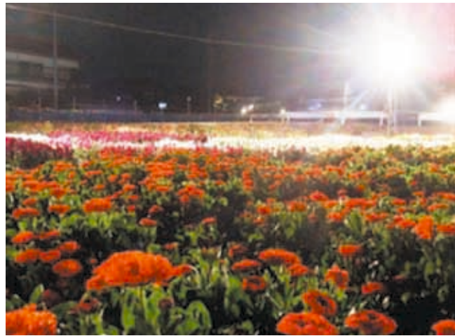
花畑ライトアップの様子

このコーナーは地域の市民活動団体を応援するコーナーです。地域でがんばっている団体をご存じでしたら情報をお寄せください。