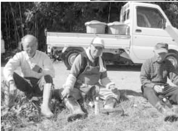
丸山老人クラブの皆さん

JAのライスセンターから提供されたモミ殻による薫炭で焼いた焼きいもを、みんなでふうふうしながらおいしそうに食べていました。