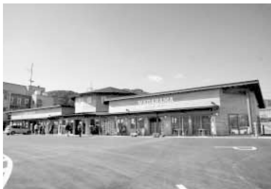
オープンした道の駅和田浦WA・O！

11月の第2週と第3週、市内では相次いで道の駅がオープンしました。最初にオープンしたのは、和田支所跡地に建設していた道の駅和田浦WA・O！。