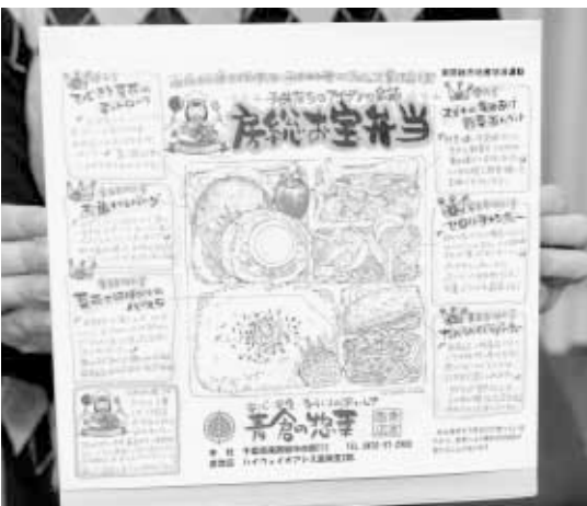
局長賞を受賞した「房総お宝弁当」。掛け紙には、内容のイラストと料理のピーアール点が紹介されています

「房総お宝弁当」は、南房総食材を使った子ども料理コンテストに入賞した6作品がおかずです。種類は、ひじきとなの花のミートローフ、お魚ハンバーグ、だんらんくじらパーティー（ツチ鯨のカツ）、スズキの竜田あげ野菜あんかけ、セロリチャンプル、ナバナとハバのりのパスタ