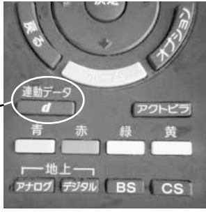
機種によりdボタンの位置は違います

・デジタルテレビ(ワンセグ) テレビのチャンネルを3チャンネル(千葉テレビ)に合わせ、リモコンのdボタンを