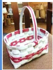
画像はイメージです