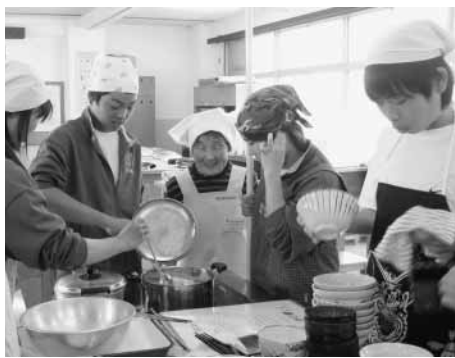
保健推進協議会富山支部 富山中学校での調理風景

今回は、「ヘルスサポーター21事業」とは、「ヘルスサポーター21事業」とは、21世紀における国民健康づくり運動で、この講習を受けた人は自らが実践者となり、家族などへ健康づくりを広めていく活動です。 主な内容は、自分の体格を確認したり、食事バランスガイドについて勉強し、千産千消(千葉県産の新鮮でおいしい、安全安心な農林水産物を県内で消費すること)のメニューで調理実習をしています。全国的に普及されている事業です。市では、全中学校(学年は学校により異なります)に出向き、活動しています。