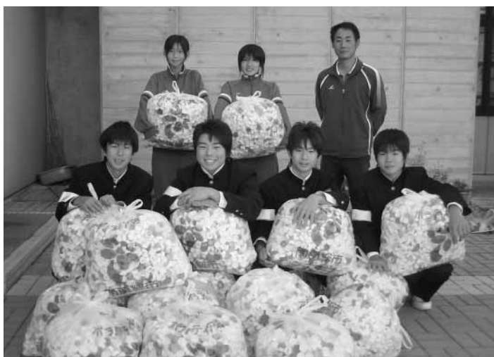
丸山中学校生徒会の皆さん42,000個のキャップを集めました!!