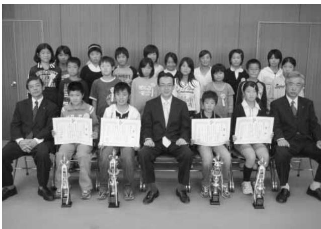
市長や環境審議会長と一緒に記念撮影