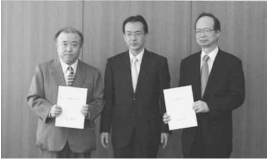
協定締結式の様子