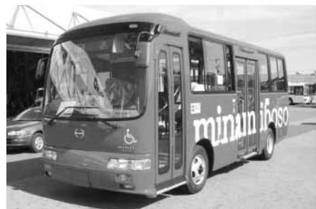
ちまたで噂のあの「赤いバス」

利用状況も順調で、和田～富浦間を片道300円で乗車できることから、多くの市民の皆さんの横断バスとして利用いただいています。