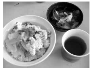
メニューの例 「牧場どんぶり」 (牛の初乳を使用しています)