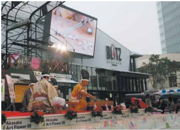
赤坂サカスでの庖丁式披露

今年から、毎年5月17日に行われる春の例大祭の中で庖丁式を行っているほか、9月19日から21日まで赤坂サカスを会場に行われた千葉県をピーアールするイベントにて、築地市場でも有名な旬の食材「千倉産黒鮪」を使って、庖丁式（式題：古式由来献上の鮪）の披露を行いました。