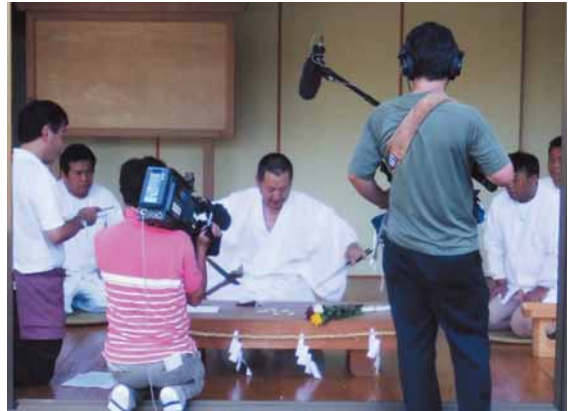
活動の様子はテレビでも紹介されました（取材の様子）

たかべ庖丁会は、その高家神社のお膝元で、地元の伝統である庖丁式を引き継いで残していきたいという思いのもと、昨年、旅館や民宿業を営む有志5人で結成しました。