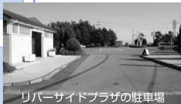
リバーサイドプラザの駐車場

また、駐車場を利用する人々のマナーの悪さに住民税を支払っている者として非常にむなしさを感じます。自分たちの支払ったお金で自分たちが不愉快に成るのは耐えられません。駐車場使用の有料化か公園利用者限定をお願いします。