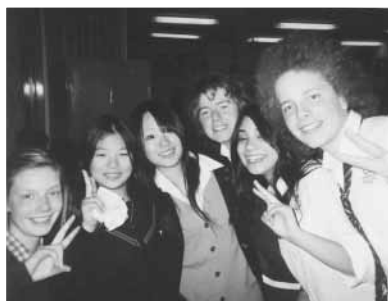
ホームステイの様子

今回の貴重な経験をムダにしないよう、これからもっとたくさん英語を勉強し、できれば留学をし、小さい頃からの夢である外国で働くという目標に向かって頑張りたいです。