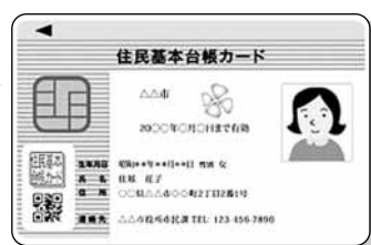
<写真付き住基カード>

住基カードは、「写真付き住基カード」と「写真なし住基カード」の2種類あります。「写真付き住基カード」なら、銀行で10万円を超える現金振り込みをするときや、郵便局で口座を開設するとき、携帯電話を新規で購入するときなどに、運転免許証やパスポートと同じく、公的な身分証明書として利用できます。