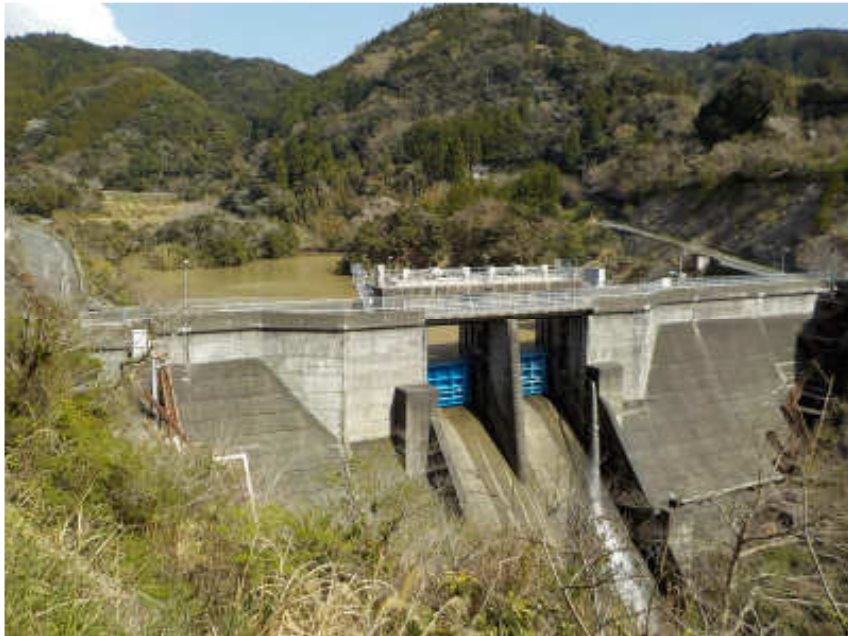
水道水源の小向ダム