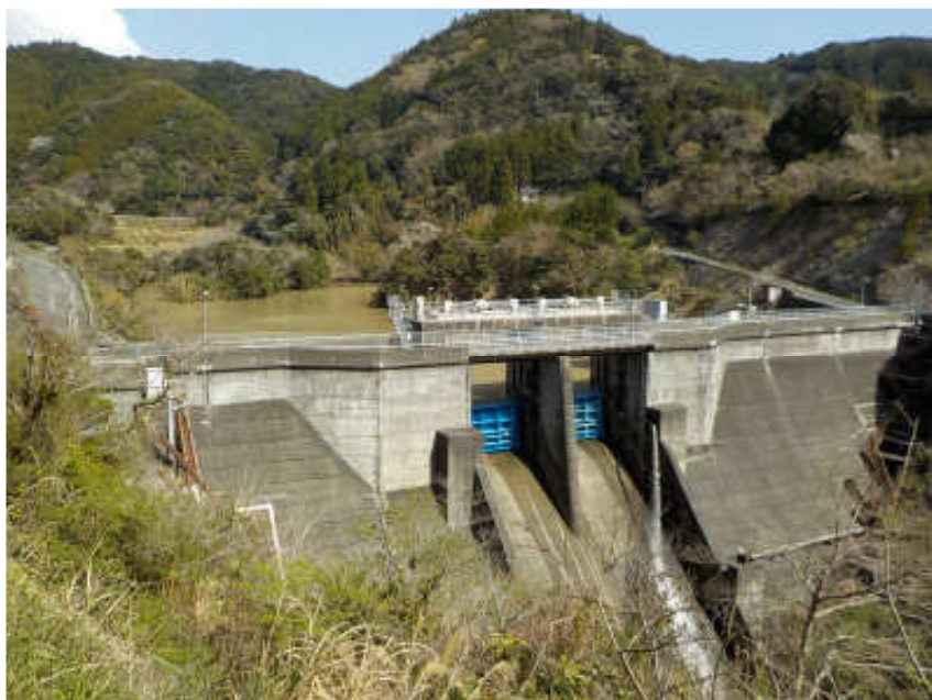
水道水源の小向ダム