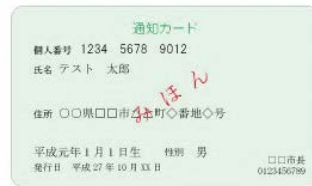
(表面) 通知カード (裏面)