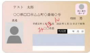
(表面) 個人番号カード (裏面)