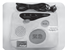
ペンダント型 送信機