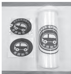
救急医療情報カプセル

新しい情報シートを希望する場合は、高齢者支援課、市民課、朝夷行政センターおよび各地域センターで配布するほか、市ホームページからダウンロードすることもできます。