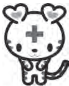
日本赤十字社公式 マスコット・キャラクター 「ハートラちゃん」

赤十字活動は、皆さんの温かいご支援により支えられています。今後ご理解とご協力をお願い申し上げます。