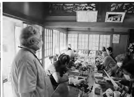
シニアを対象とした教室