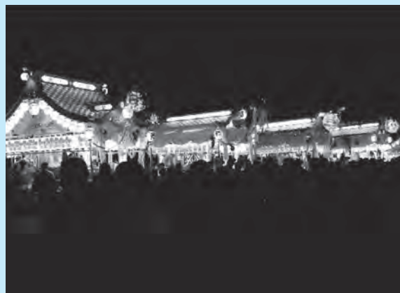
今年は6基の担ぎ屋台が並び、多くの見物人が旧平群小学校グラウンドに集まりました。

“担いで” “走って” 旧平群小学校グラウンドに入る姿は見物人を大いに沸かせ、6基の担ぎ屋台が並び姿はとても壮観でした。