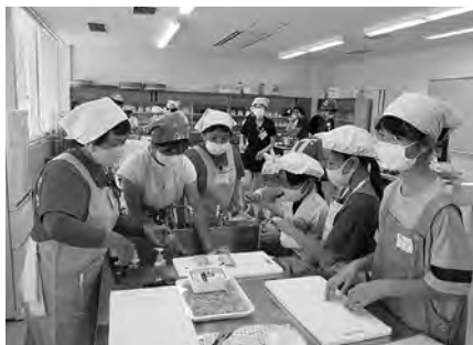
夏休み小学生クッキング教室