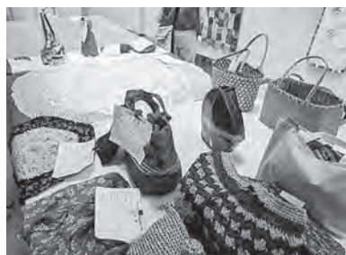
バッグやレース編み