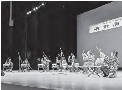
中三原老人クラブによる竹太鼓の演奏

演芸大会では、クラブ会員により、楽器演奏、合唱、舞踊などが披露されました。観覧席からは、手拍子や声援が送られていました。