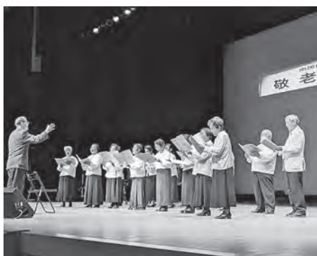
千倉地区・南千倉老人クラブ南寿会による合唱