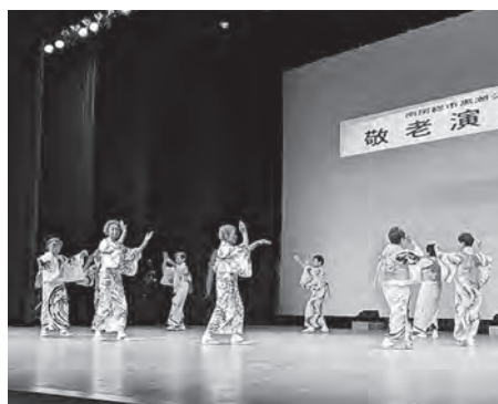
白浜地区・下沢老人クラブによる舞踊