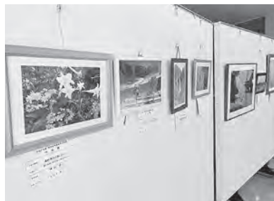
さまざまな写真や絵画