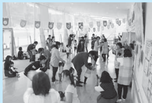
親子でふれあいながら楽しんだダンス

親子やお友達と協力する競技などを通して、子どもたちの成長を感じ、絶えず笑顔があふれる運動会になりました。