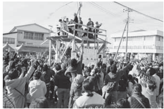
昨年の産業まつりの様子