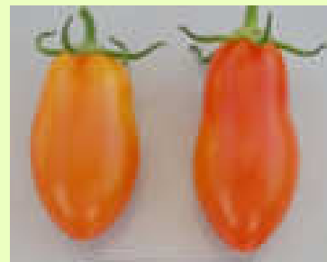
品目：ミニトマト 症状：果実が細長く変形