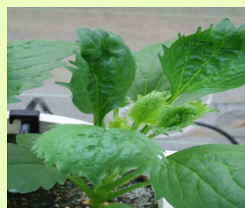
品目：アスター 症状：葉の異常