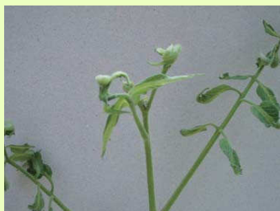
品目：トマト 症状：葉の異常