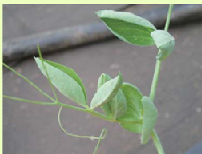
品目：さやえんどう 症状：葉がカップ状になる