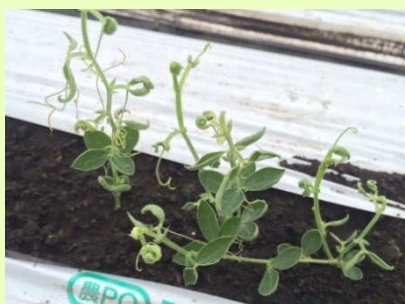
品目：スイートピー 症状：葉の異常