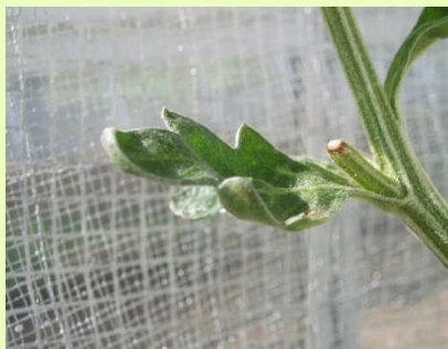
品目：きく 症状：葉の異常