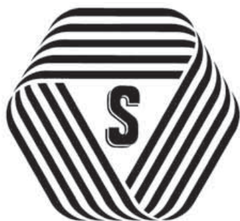
厚生労働大臣認可