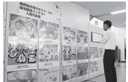
昨年の展示の様子