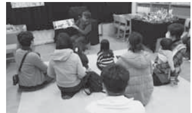
<千倉しおまねきによる読み聞かせ>