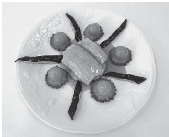
昨年度の最優秀賞「ひまわりハンバーグ」