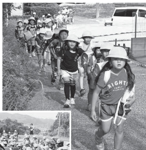
津波を想定した高台への避難の様子(富山小学校)

登校時間帯の防災訓練は、3回目、バス停で地震にあった場合や、徒歩や自転車での登校時など、各学校でいろいろなパターンを想定した訓練を行いました。