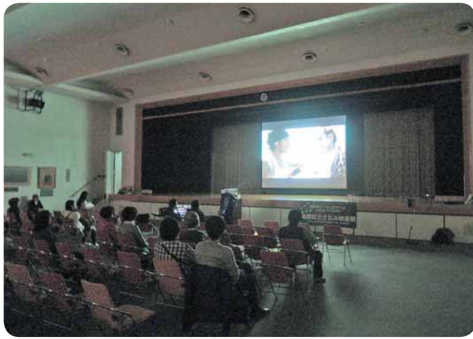
さざなみ映画祭の様子

このコーナーは、地域の市民活動団体を応援するコーナーです。地域でがんばっている団体をご存じでしたら、情報をお寄せください。