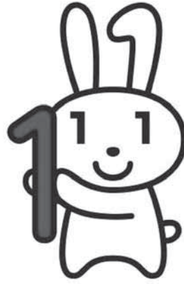
マイナンバー広報用キャラクター 「マイナちゃん」

社会保障・税番号 (マイナンバー)制度 は、国民の利便性を高 め、行政の事務を効率 化し、公平・公正な社 会を実現することを目 的とした社会基盤制度 です。