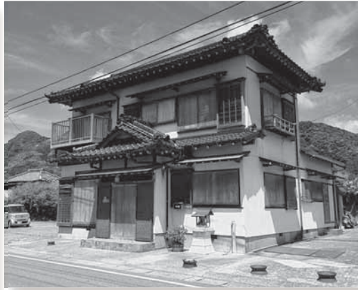
現在、空き家バンクに登録されている物件

市では、移住・定住対策の一環として、市内の空き家の有効活用を通して、市への移住定住希望者との橋渡しを行い、定住促進を図る、空き家バンク事業を実施しています。