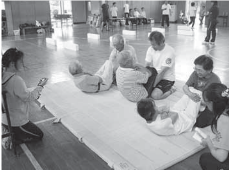
前回の高齢者体力テストの様子

種目は、握力・上体起こし・長座体前屈・開眼片足立ち・10メートル障害物歩行・6分間歩行テストの6種類です。