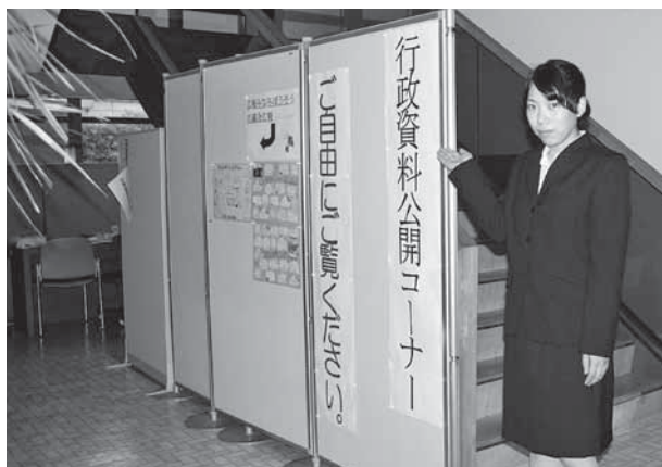
行政資料公開コーナー