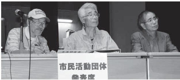
公開プレゼンテーションでの提案の様子

生ごみでたい肥作り、体幹トレーニングの普及、手作りシーカヤック、市民映画祭、里山保全、フットパスなど、多彩な市民活動が始まります。