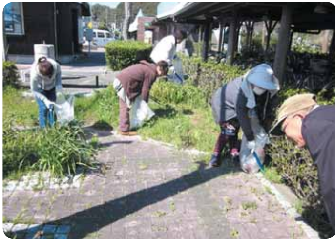
富浦駅周辺の清掃

このコーナーは、地域の市民活動団体を応援するコーナーです。地域でがんばっている団体をご存じでしたら、情報をお寄せください。