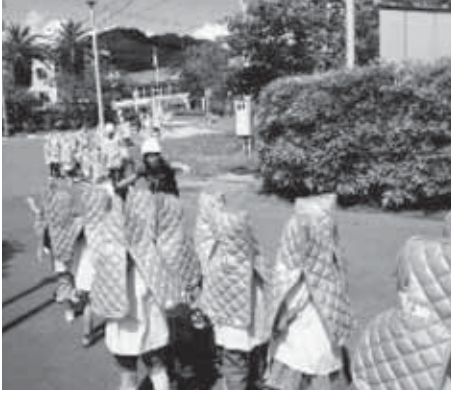
昨年度の防災訓練の様子

子どもたちだけで登校する児童生徒やスクールバスを利用する幼児児童生徒が、事前の指導や避難計画に基づき高台などへ避難をします。