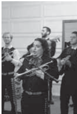
北テキサス大学のマリアッチ楽団 A mariachi band at the University of North Texas

シンコ・デ・マヨというのは、スペイン語で5月5日という意味です。1862年5月5日は、メキシコ軍がプエブラ市からフランス軍の侵入を撃退させた日で、メキシコとアメリカでは記念日として祝われています。その戦争が終わってからは、アメリカ大陸の国がヨーロッパの国に侵攻されたことは一度もないので、シンコ・デ・マヨは重要な出来事でした。メキシコ人とメキシコ系アメリカ人はシンコ・デ・マヨを祝い、メキシコ人であることを誇りに思っています。けれども他のアメリカ人は、5月5日をメキシコ料理を食べ、お酒を飲んだりする口実に使います。メキシコ料理のレストランでタコスやケサディーヤなどを食べながら、メキシコ産のビールやマルガリータを飲んで祝います。(マルガリータというのはテキーラに果汁と氷を加えたカクテルです。) また、マリアッチ音楽もシンコ・デ・マヨに欠かせないものの一つです。マリアッチ楽団は、ギター、アコースティック・ベース、ギター、トランペット、バイオリンとボーカルの組み合わせが典型的で、メキシコ料理のレストランでよく演奏しています。特徴的なものとして、ソンプレロというつばの広い帽子を被っています。私がシンコ・デ・マヨを好きな理由は、なんといってもメキシコ料理が世界で一番美味しいと思うからです。