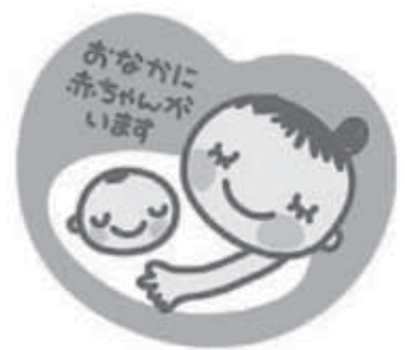
マタニティマーク