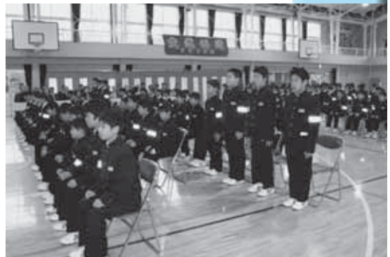
富浦中学校入学式

更新された車両2台は同型で、日野自動車のシャシーをもとにGMいちばら工業が製造したCD-1型消防ポンプ自動車で、遠距離放水に適したポンプを搭載しています。