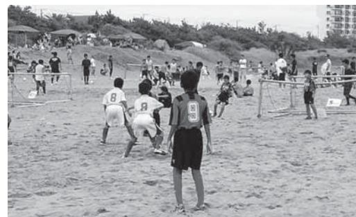
昨年のビーチサッカーの様子