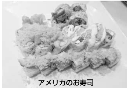
アメリカのお寿司