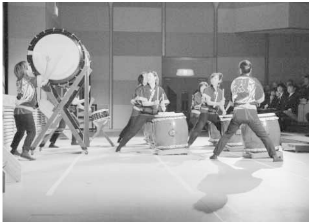
安房八幡太鼓の演奏が新成人を祝いました