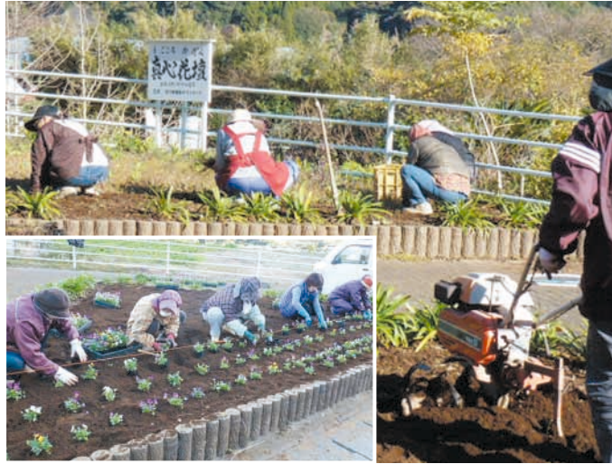
会員皆さんの笑顔が楽しみで活動しています

このコーナーは地域の市民活動団体を応援するコーナーです。地域でがんばっている団体をご存じでしたら情報をお寄せください。