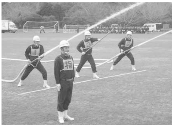
安全的確なポンプ車操法演技