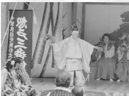
忽戸の三番叟 (昭和45年1月28日県指定)