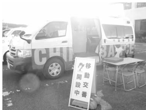
市役所駐車場で開設中の移動交番

関する啓発記事、巡回予定場所などを掲載しています。 移動交番の開設時間は、各開設場所 所 で90分ほどです。