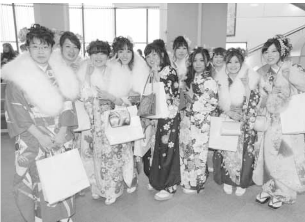
玄関ロビーで記念撮影