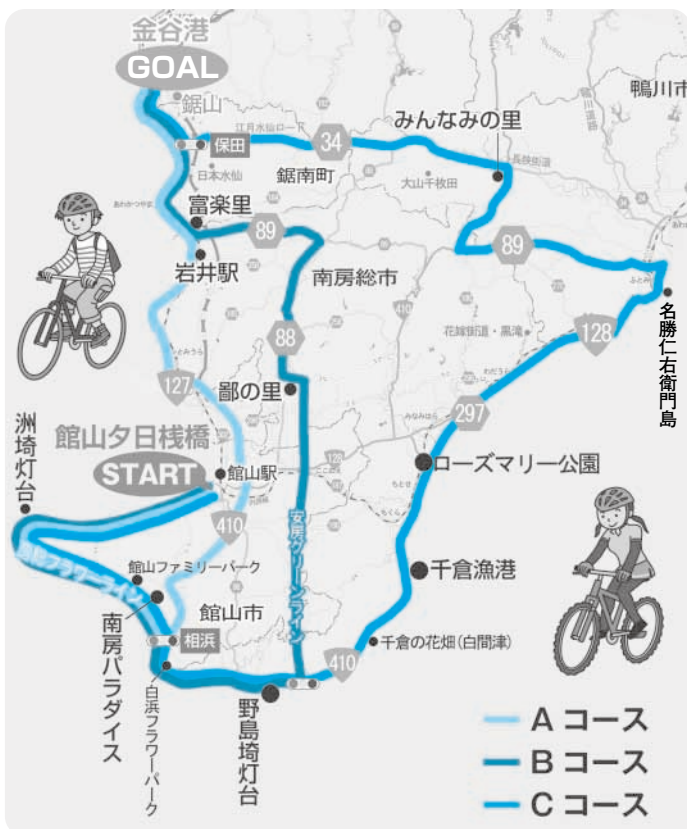
当日のサイクリングコース